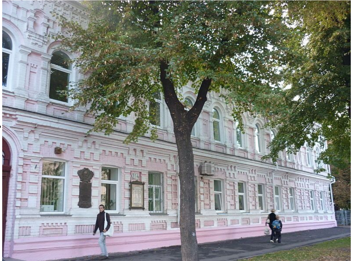
Гімназія Городецького в місті Черкаси

Владислав Городецький будував гімназії в Умані та Черкасах, в Мошнах — лікарню, в Шпикові — цукровий завод, в Печері — мавзолей Потоцьких, в Євпаторії — власну віллу тощо.