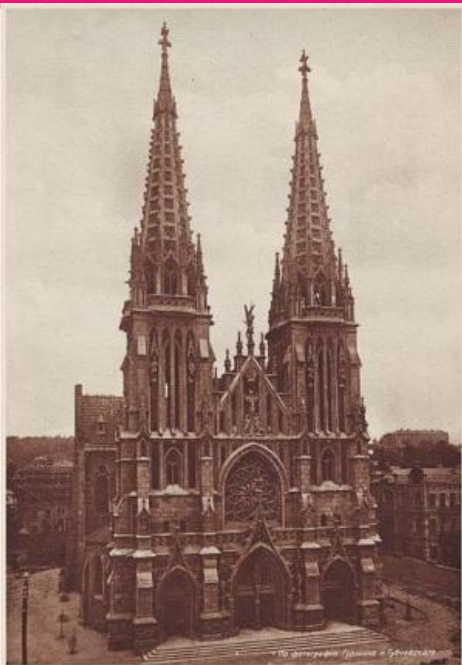
Неретъ ѿ Никонан