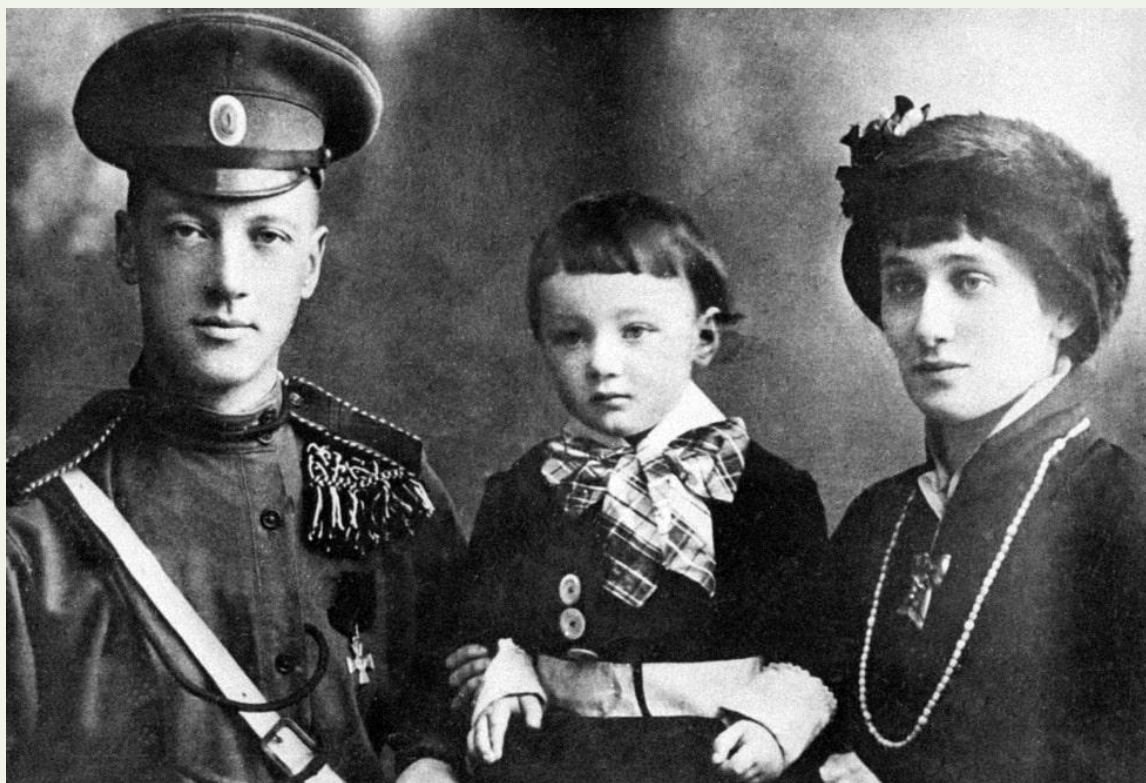
Анна Ахматова с первым мужем Н. С. Гумилёвым и сыном Львом