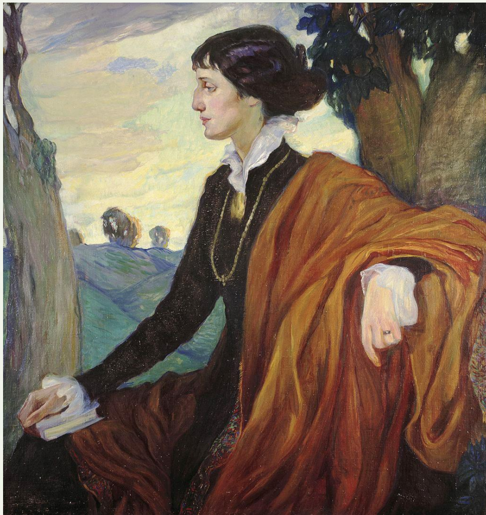
Портрет Ахматовой, 1914 г.