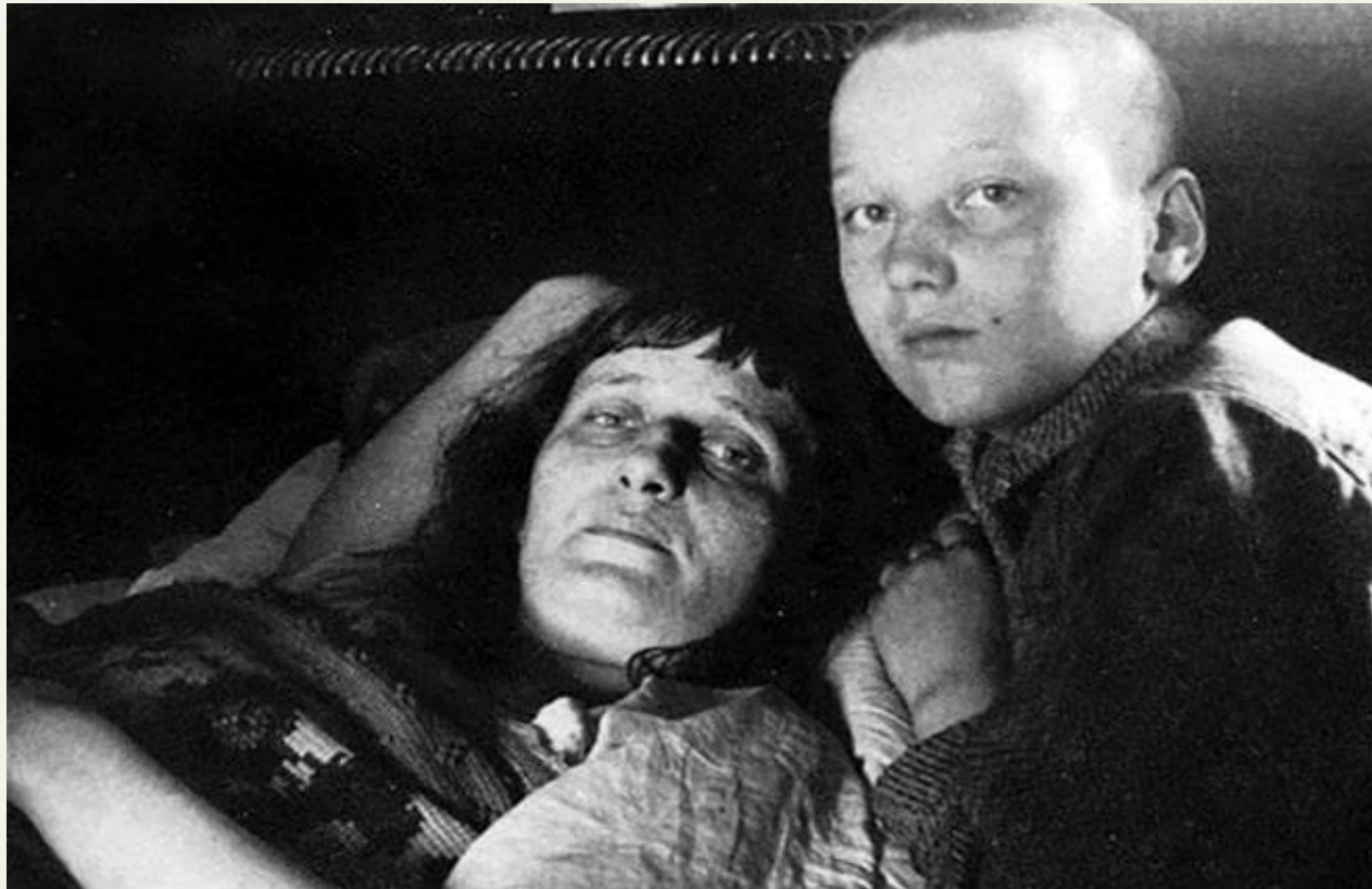
Анна Ахматова с сыном Львом Гумилевым