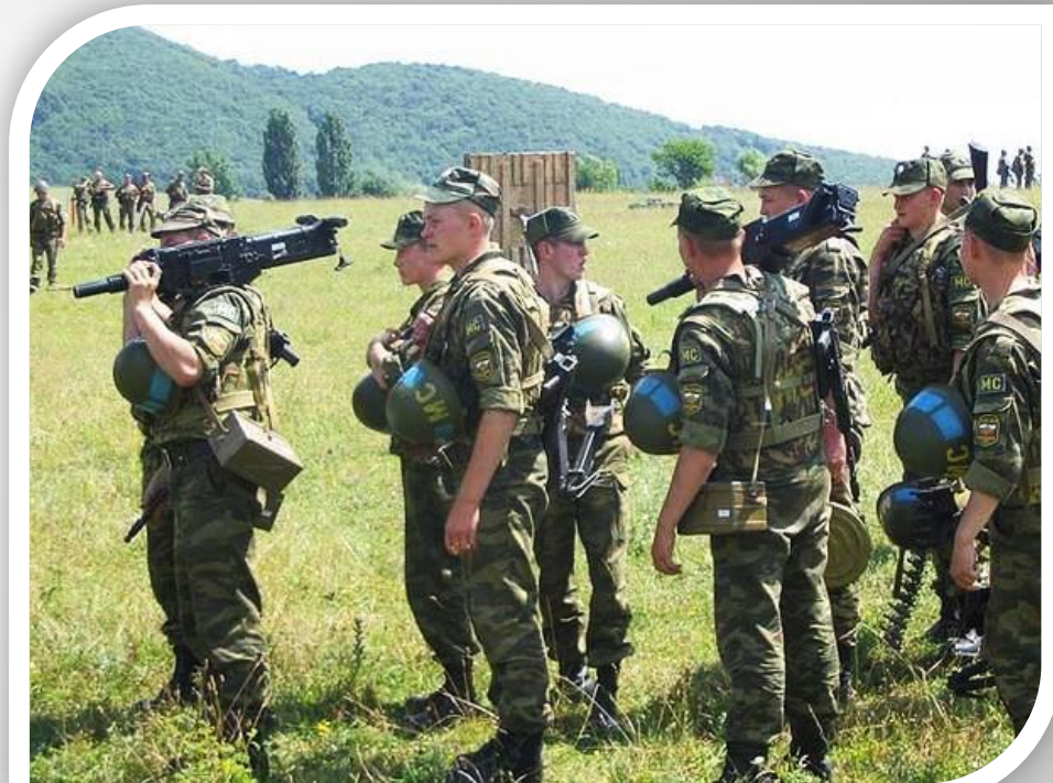
Российские миротворцы в Осетии

7 и 8 августа 2008 г. Д. Медведевым и В. Путиным принято совместное решение о начале военной операции по принуждению Грузии к миру.