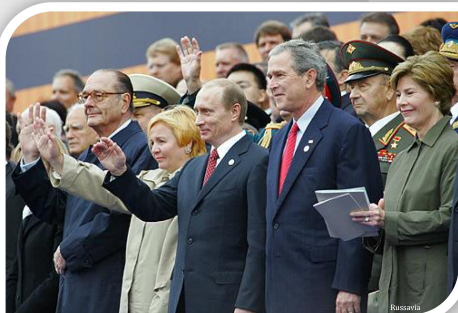
В. Путин во время Парада Победы

9 мая 2005 года в ходе торжеств по случаю 60-ти летия Победы в Великой Отечественной войне Путин и другие мировые лидеры призвали к борьбе с «нацизмом XXI века» — терроризмом и поблагодарили победителей фашизма. Впервые участвовали лидеры ведущих держав