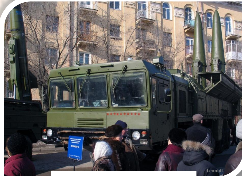
Ракетный комплекс «Искандер» 9К720

В феврале 2012 г. в качестве ответной меры в Калининградской области начались приготовления к размещению там ракетных комплексов «Искандер» 9К720.