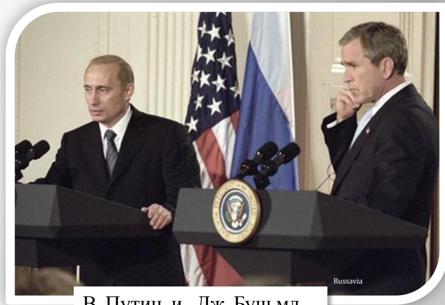
В. Путин и Дж. Буш мл.

В июне 2001 года Путин первый раз встретился с Президентом США Джорджем Бушем (младшим) в столице Словении Любляне.