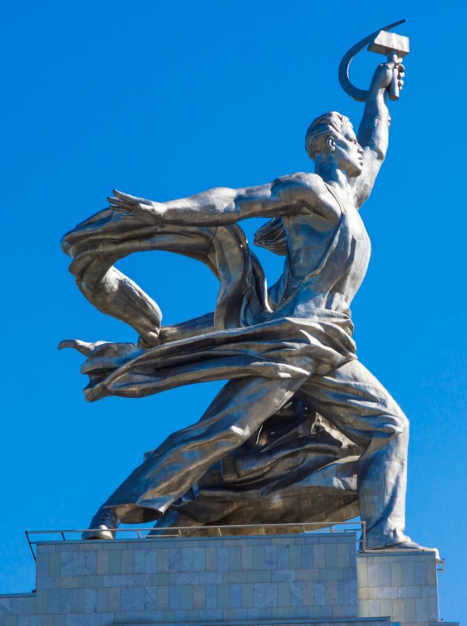
Фото памятника Рабочий и Колхозница, созданного архитектором Верой Мухиной долго были символом не просто Москвы, а всей страны – СССР. Созданный в 1937 году, памятник воплощал социальные достижения Страны Советов и говорил, что главный в СССР именно рабочий человек – созидатель.

Сам монумент выполнен из нержавеющей стали и весит вместе с постаментом около 200 тонн. Сама концепция памятника принадлежала одному из главных архитекторов СССР Борису Михайловичу Иофану. Он же разработал и первый макет памятника.