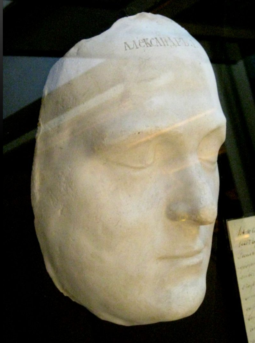
ПОСМЕРТНАЯ МАСКА АЛЕКСАНДРА I