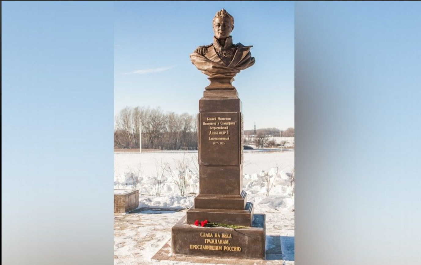
ПАМЯТНИК-БЮСТ В СЕЛЕ “ПАНИКОВЕЦ” ЛИПЕЦКОЙ ОБЛАСТИ АЛЕКСАНДРУ 1