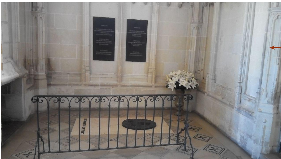
Могила Леонардо да Винчи в замке Амбуаз