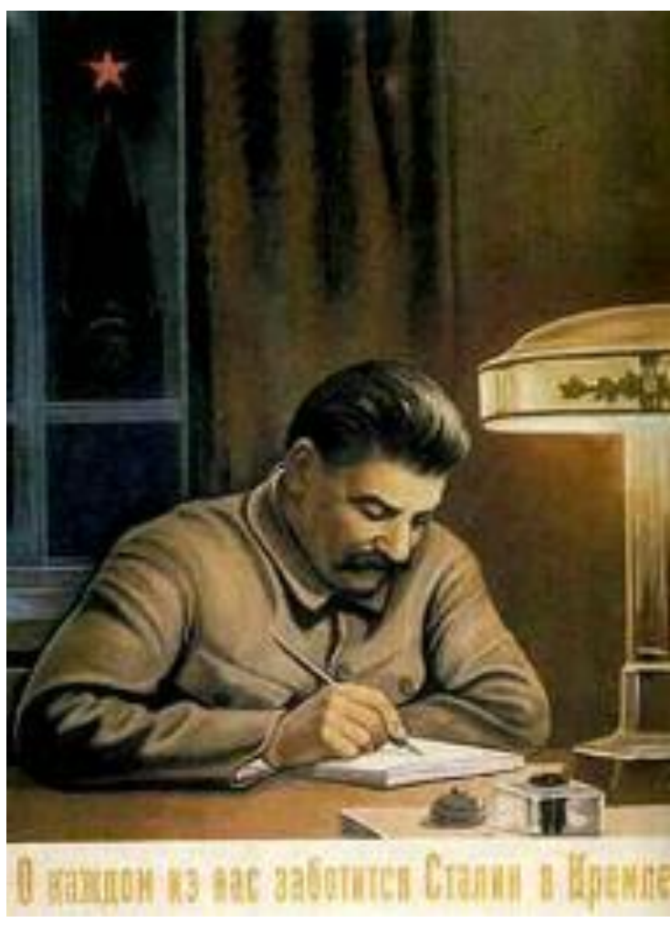
Плакат 1932 г.(р.т.3)

Характерной чертой политической жизни этого периода стал культ личности И.Сталина. 21 декабря 1929 г., в день 50-летия Сталина, страна узнала, что у нее есть великий вождь. Он был объявлен «первым учеником Ленина». Вскоре Сталину стали приписывать все успехи страны. Он именовался «великим», «мудрым», «вождем мирового пролетариата», «великим стратегом пятилетки».