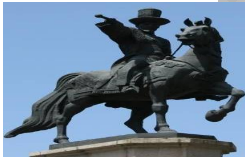
Амангелді Имановқа арналған ескерткіштер