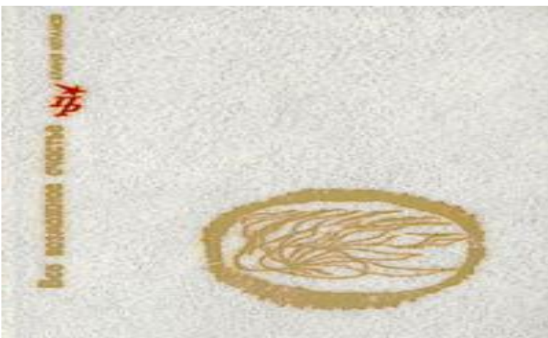
Халық батыры туралы кітап