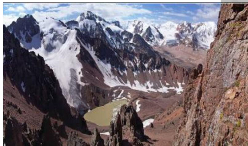
Амангелді Иманов атындағы шың