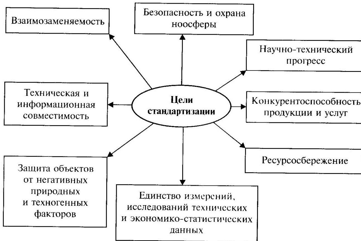
Рис. 4.1. Цели стандартизации