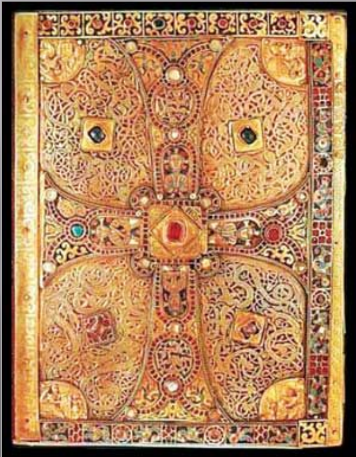
Переплёт книги XV века

Переплёт книги, как правило деревянные, обтягивали кожей и нередко украшали пластинками из слоновой кости, золотом или драгоценными камнями. Размеры книг могли быть самыми разнообразными: от крупных до совсем крошечных, где фигурки миниатюр были размером с булавочную головку.