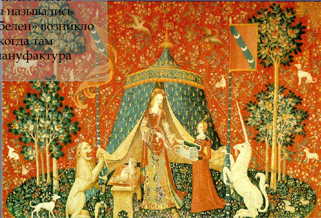
Шпалера из серии «Дама с единорогом»

Гобелен — стеной безворсовый ковёр с сюжетной или орнаментной композицией, вытканый вручную перекрёстным переплетением нитей. Первоначально гобелены назывались шпалерами . А слово «гобелен» возникло во Франции в XVII веке, когда там открылась королевская мануфактура братьев Гобеленов