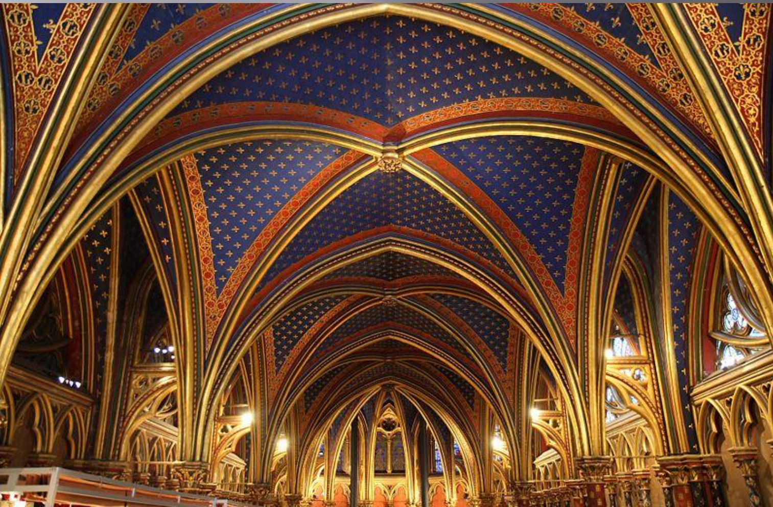
Готические (крестовые) своды Сен-Шапель

Свод (от «сводить» — соединять, смыкать) — тип перекрытия или покрытия сооружений, конструкция, которая образуется выпуклой криволинейной поверхностью. Своды позволяют перекрывать значительные пространства без дополнительных промежуточных опор.