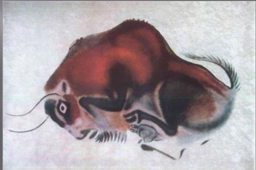
Роспись пещеры Альтамира, Испания

Живопись - очень древнее искусство, прошедшее на протяжении многих веков эволюцию от наскальных росписей палеолита до новейших течений живописи XX в.