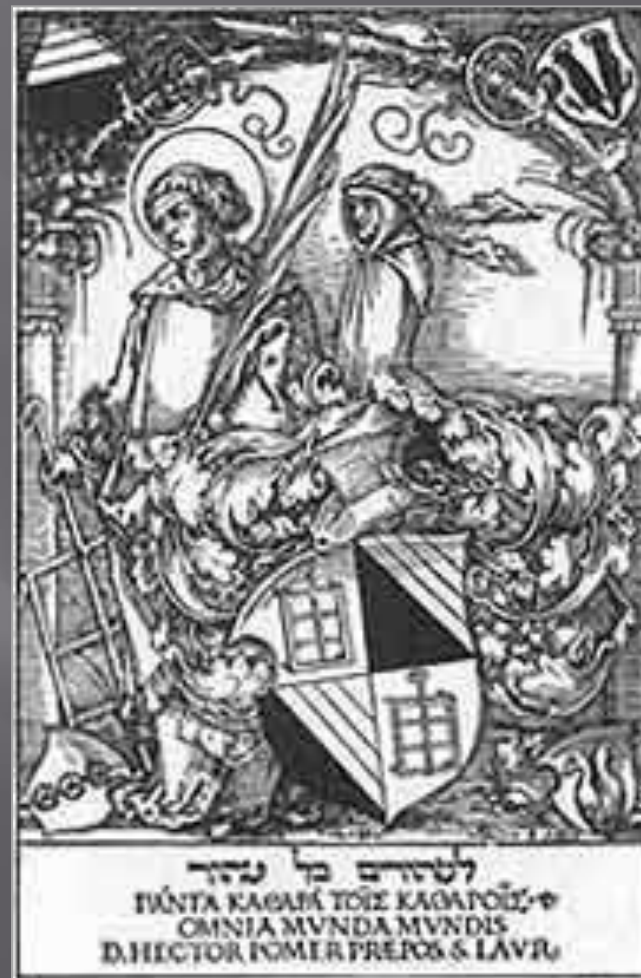
Гравированный экслибрис немецкого художника Альбрехта Дюрера

Экслибрис (от лат. ex libris «из книг») — книжный знак, наклеиваемый владельцами библиотек на книгу, преимущественно на внутреннюю сторону переплета. Обычно на экслибрисе обозначены имя и фамилия владельца и рисунок, лаконично и образно говорящий о профессии, интересах или о составе библиотеки владельца. Родиной экслибриса считают Германию, где он появился вскоре после изобретения книгопечатания.