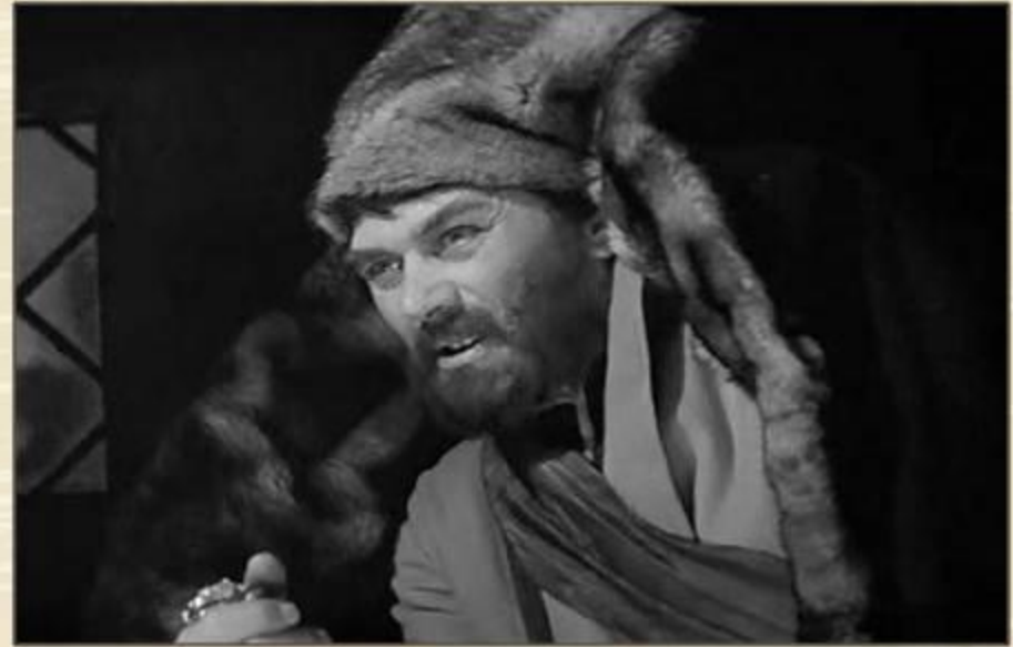
Кадр из фильма «Капитанская дочка» (1958)