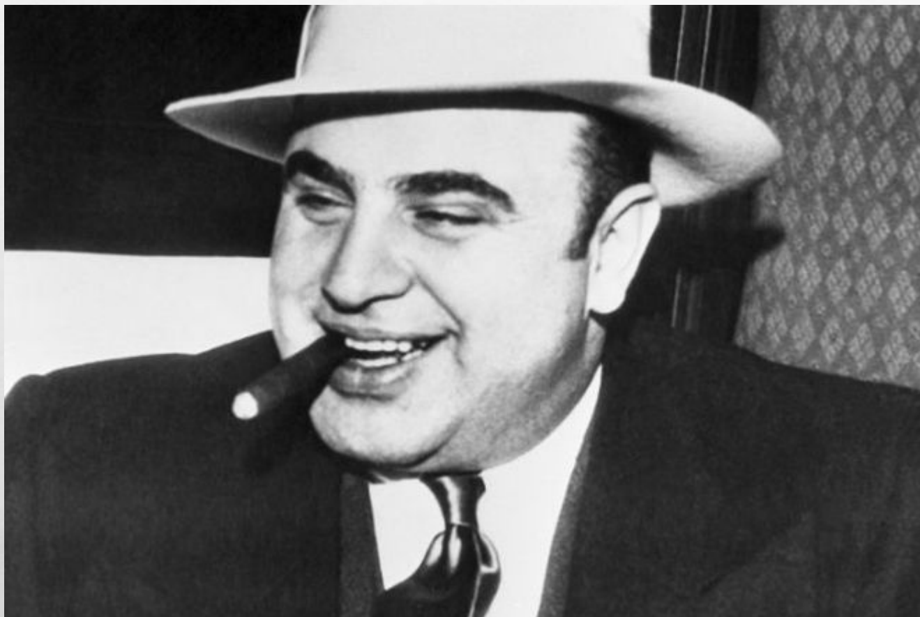
• АЛЬ КАПОНЕ