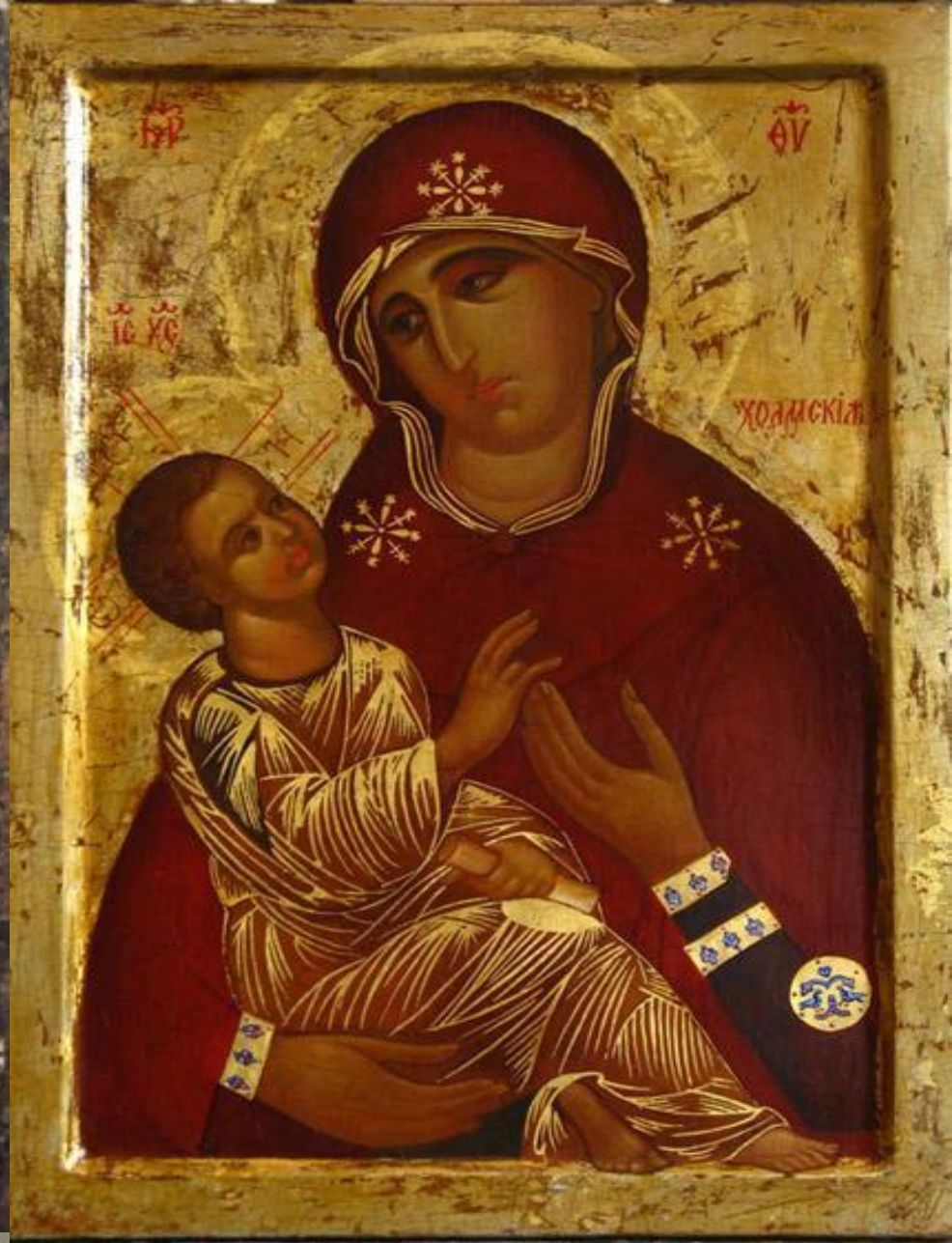
Холмська ікона Богородиці