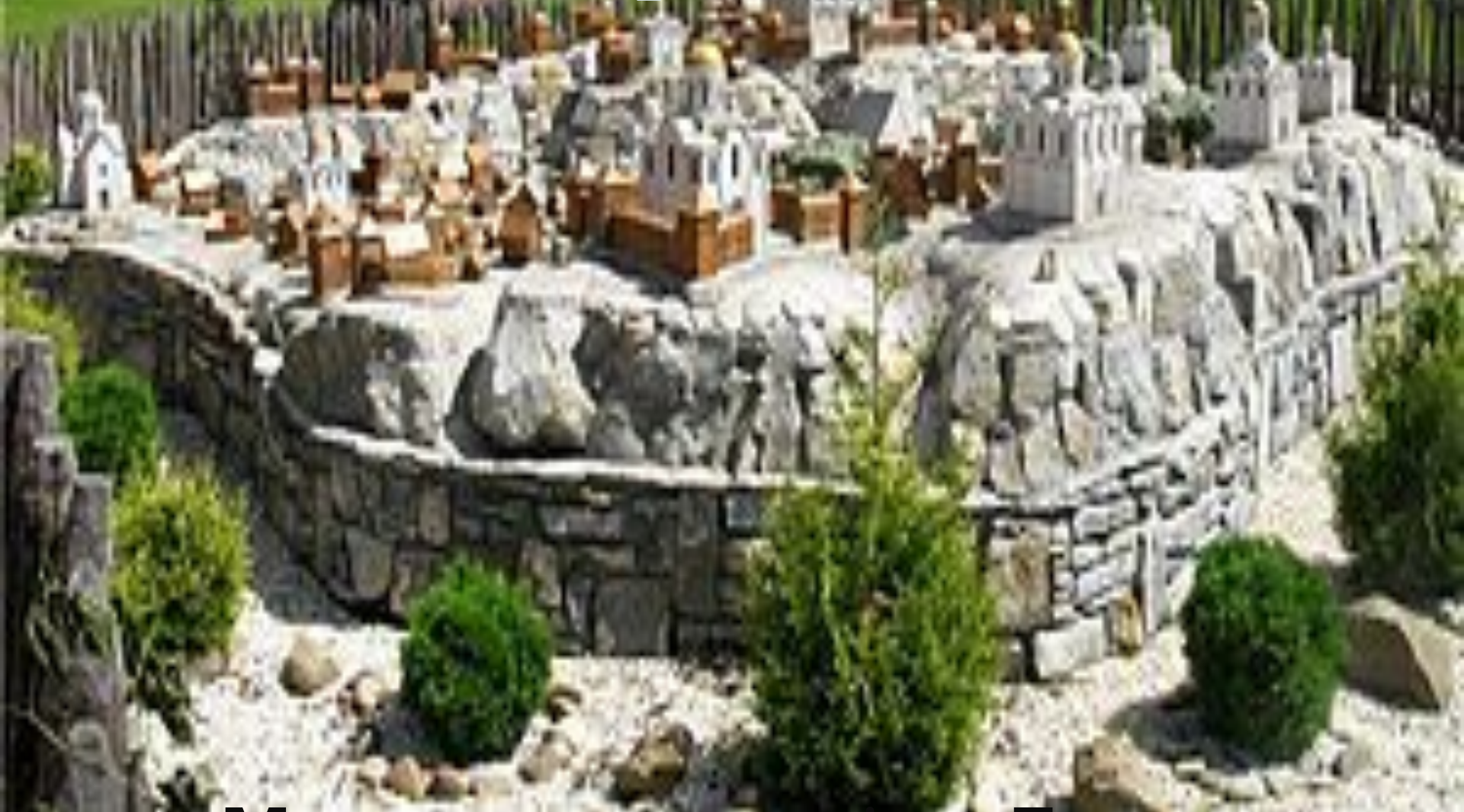
Макет давнього міста Галич