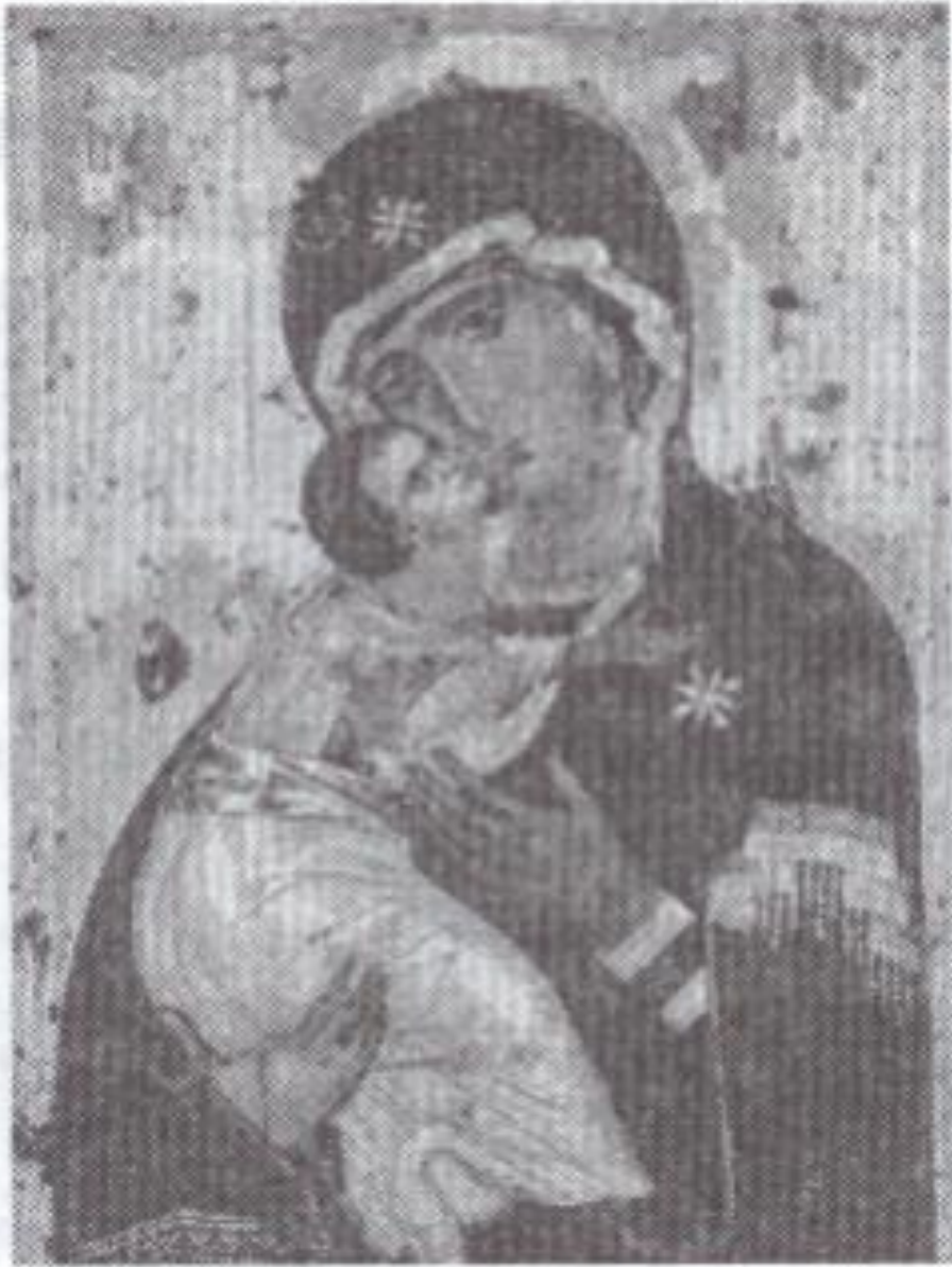
Ікона Вишгородської Богоматері

Великого значення в зображеннях на іконах надавалося кольорам. Так, золотистий і жовтий символізували небесне царство, білий – перетворення небесного на землі, блакитний – небо, зелений – усе земне, різні відтінки червоного – царське, божественне походження й виявлення ласки божої.