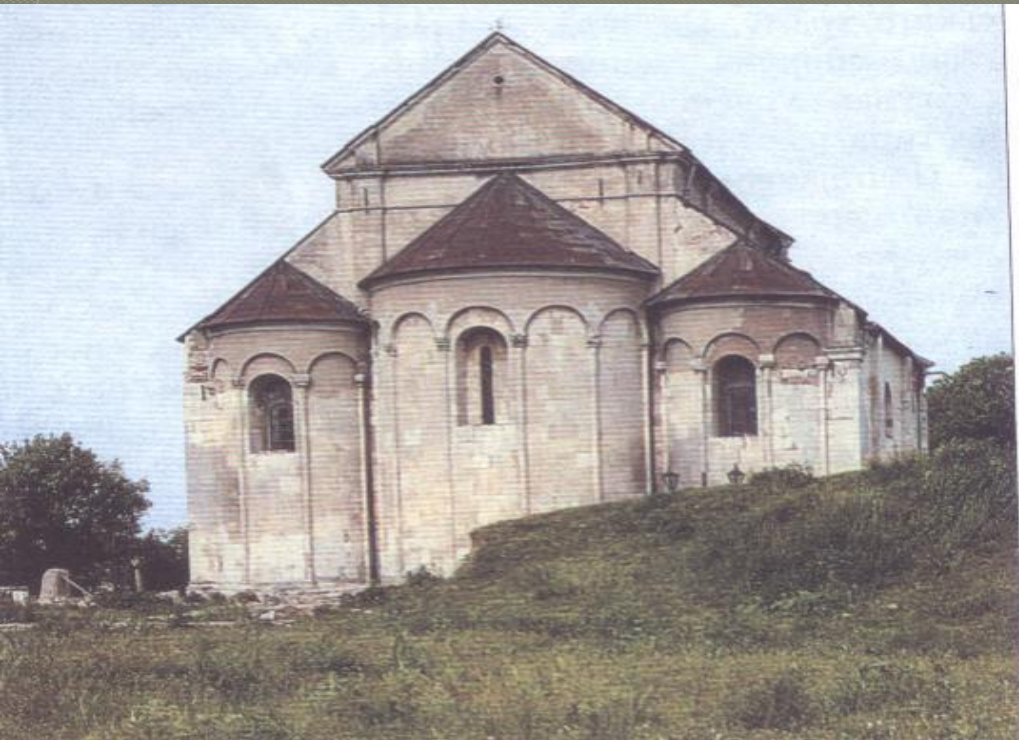
Церква св. Пантелеймона. Галич. Сучасний вигляд.