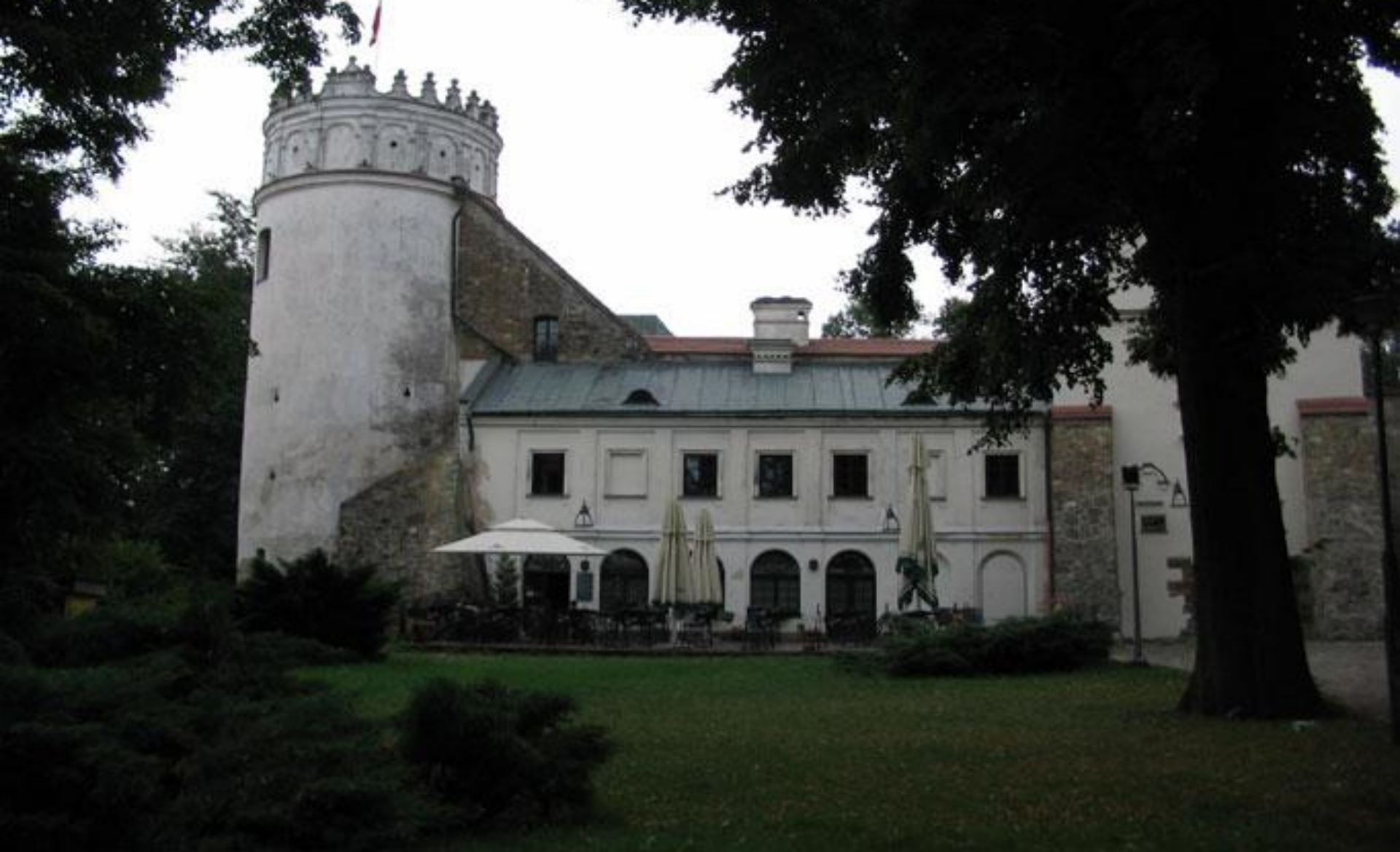
Вежа в селі Стовп поблизу Холма (середина XIII століття)