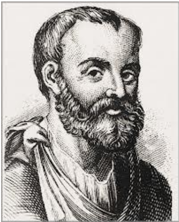
Клавдий Гален (129-201 гг. н. э.).

- римский медик, хирург и философ. Гален внёс весомый вклад в понимание многих научных дисциплин, включая анатомию, физиологию, патологию, фармакологию, и неврологию, а также философию и логику.