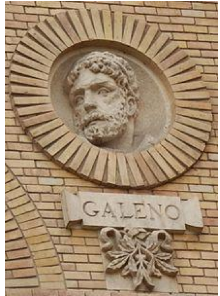
Университет Сарагосы (Испания)

- римский медик, хирург и философ. Гален внёс весомый вклад в понимание многих научных дисциплин, включая анатомию, физиологию, патологию, фармакологию, и неврологию, а также философию и логику.