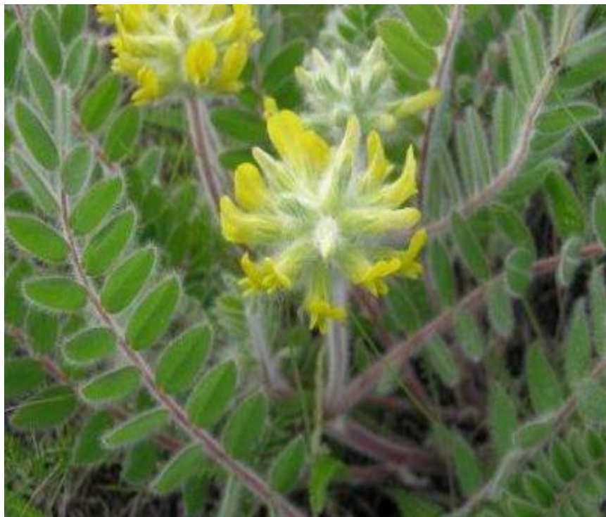
Астрагал шерстистоцветковый ( Astragalus dasyanthus Pall), скифская трава