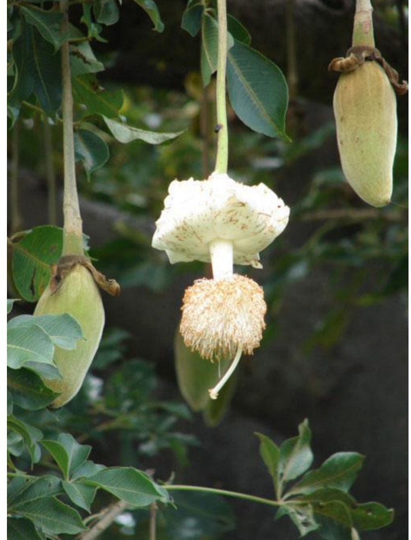
Адансония пальчатая - ( Adansonia digitata ) Баобаб – «дереву-аптека»