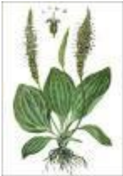
Plantago major L.