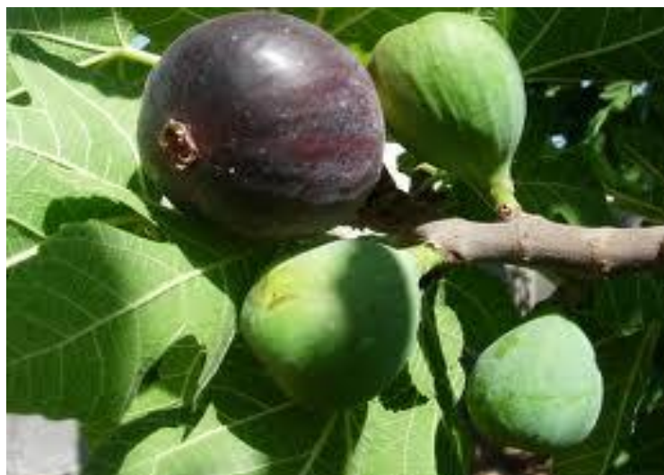
Ficus carica L.

Авл Корнелий Цельс (конец I века до н. э. - начало I века н. э.). Родился ок. 25 в до н. э. - ок. 50 н. э.) - древнегреческий философ и врач. Ему принадлежит первое издание медицинской энциклопедии.