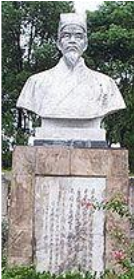
Бюст Ли-Ши-Чжень в ботаническом саду г. Чжишоу