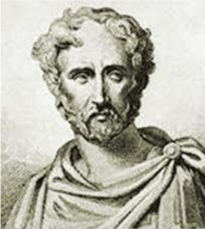
Плиний Старший 23-79 г.г. д.н.э

Автор «Естественной истории» в 37 книгах. Используя разнообразные источники, часто заимствовал и нелепые события, принимая их на веру. Книги 12-27 – посвящены растениям (около 1000 видов).