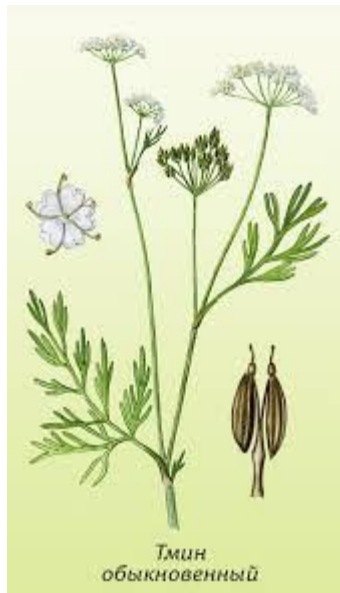
Carum carvi L.