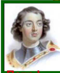
Петр I 1682-1725

Период в истории России с 1725 по 1762 гг.