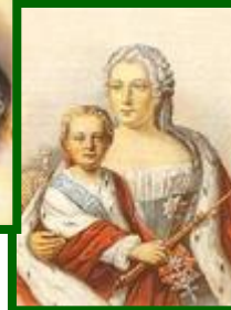
Иван VI Антонович и Анна Леопольдовна 1740-1741