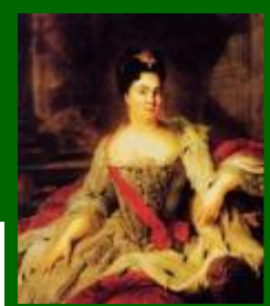
Екатери на I 1725-1727