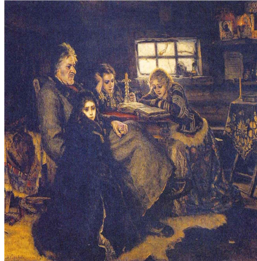
В.Суриков. Меншиков в Берёзове.

Умер Пётр II в 1730 г. от оспы. С его смертью пресеклась мужская линия рода Романовых.