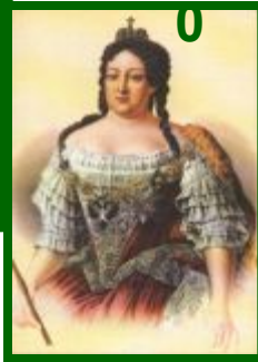
Анна Иоаннов на 1730-1740