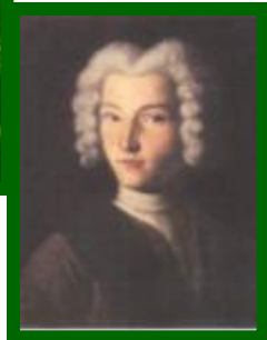
Петр II 1727-1730