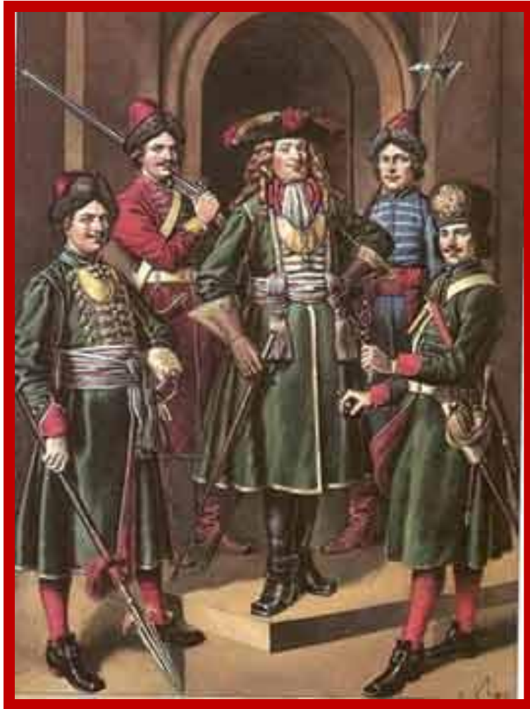
С. Летин "Служилое платье от Петра Великого. Гвардейские мундиры"