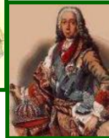
Петр III 1761-1762