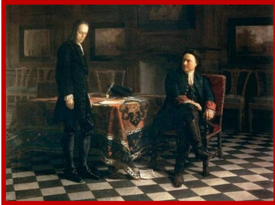
Николай Ге. Петр I допрашивает царевича Алексея Петровича в Петергофе