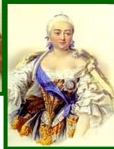
Елизавета Петровна 1741-1761