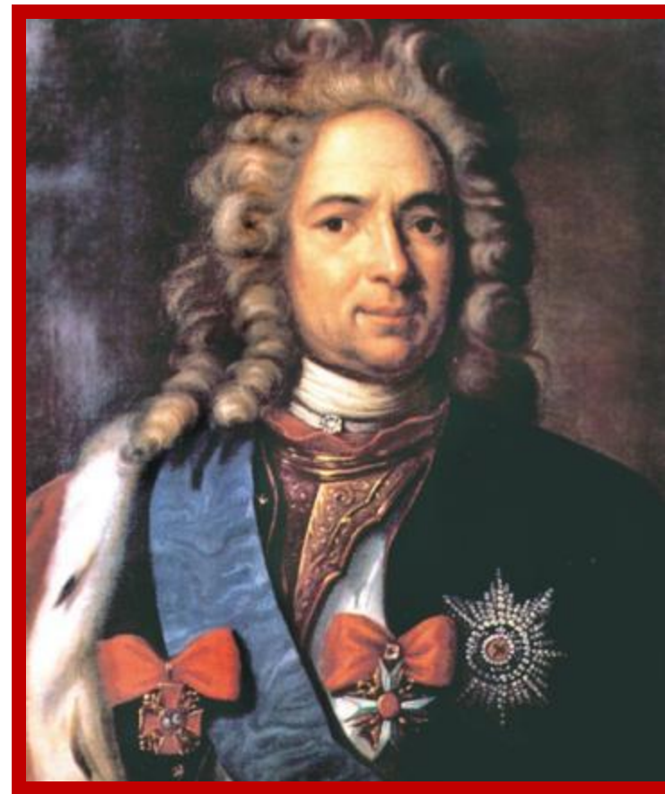
Александр Данилович Меншиков