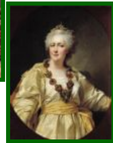
Екатерина II 1762-1796