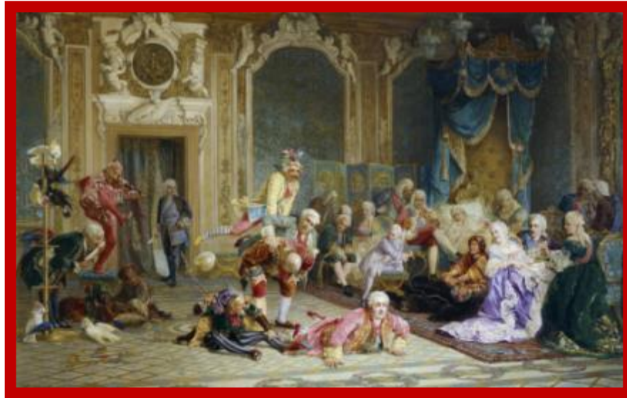
Якоби Валерий Иванович. Шуты при дворе императрицы Анны Иоанновны.

1730-1740 гг. - правление Анны Иоанновны Племянница Петра I, вышедшая замуж за герцога Курляндского, прозвище «Кровавая», «Митавская затворница».