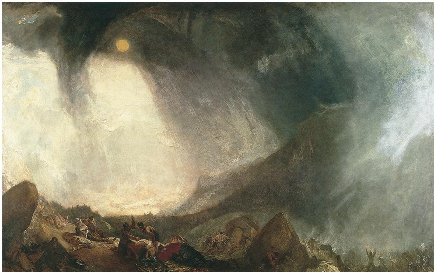
Снежная буря. Переход Ганнибала через Альпы. 1812 г.