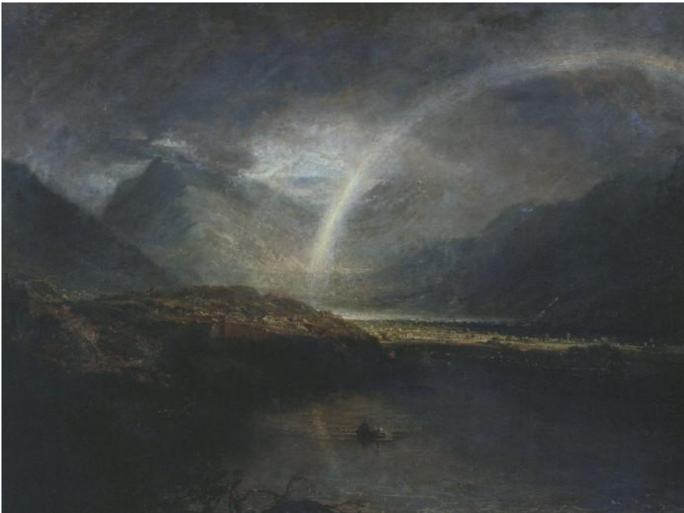
«Пейзаж с белой радугой» 1806 г.