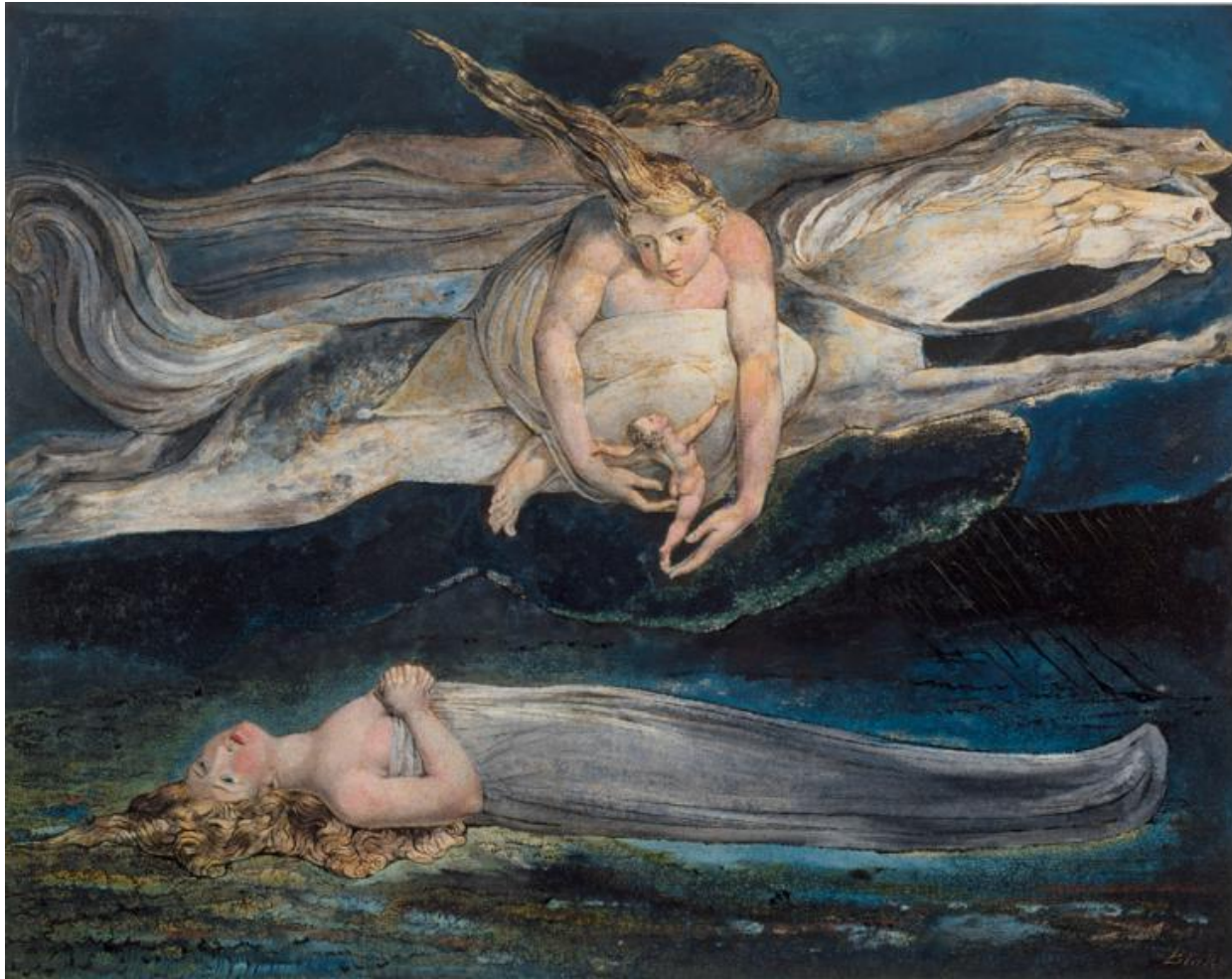
«Жалость» (около 1795 г.)