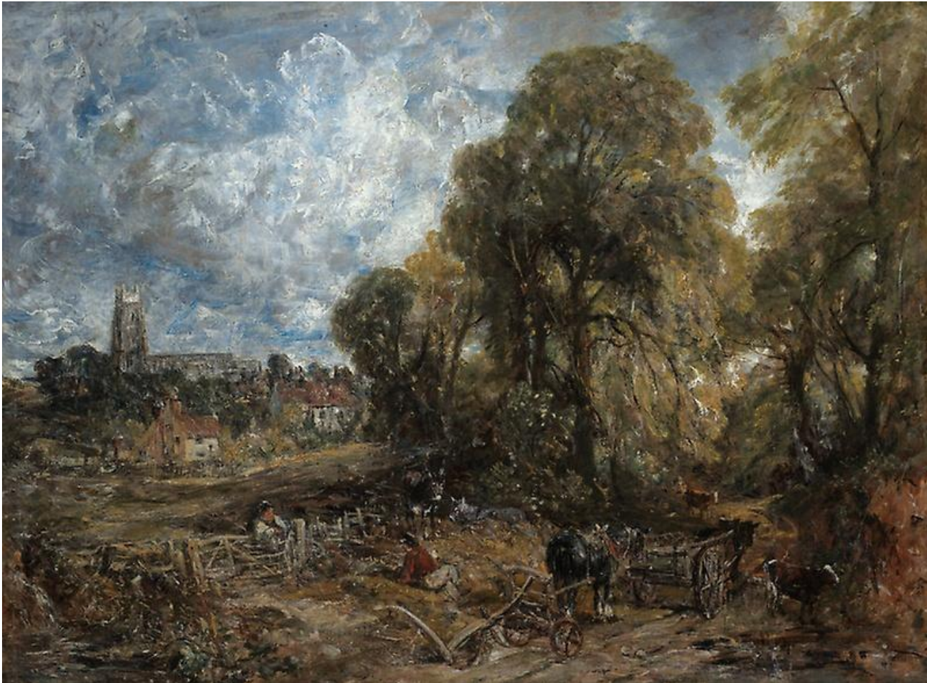
«Стокбай Нейленд» (1836 г.)