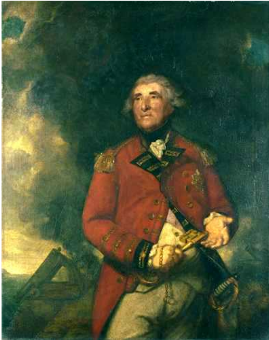
Джошуа Рейнольдс. Генерал Джордж Эллиот , 1787.