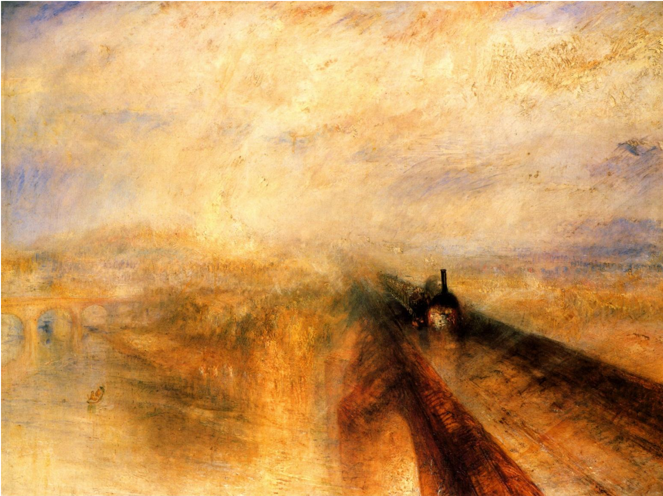
Дождь, пар и скорость. 1844 г.