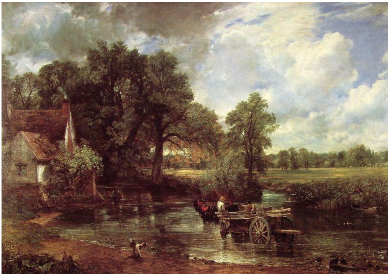
Джон Констебл. Телега для сена. 1821 г.