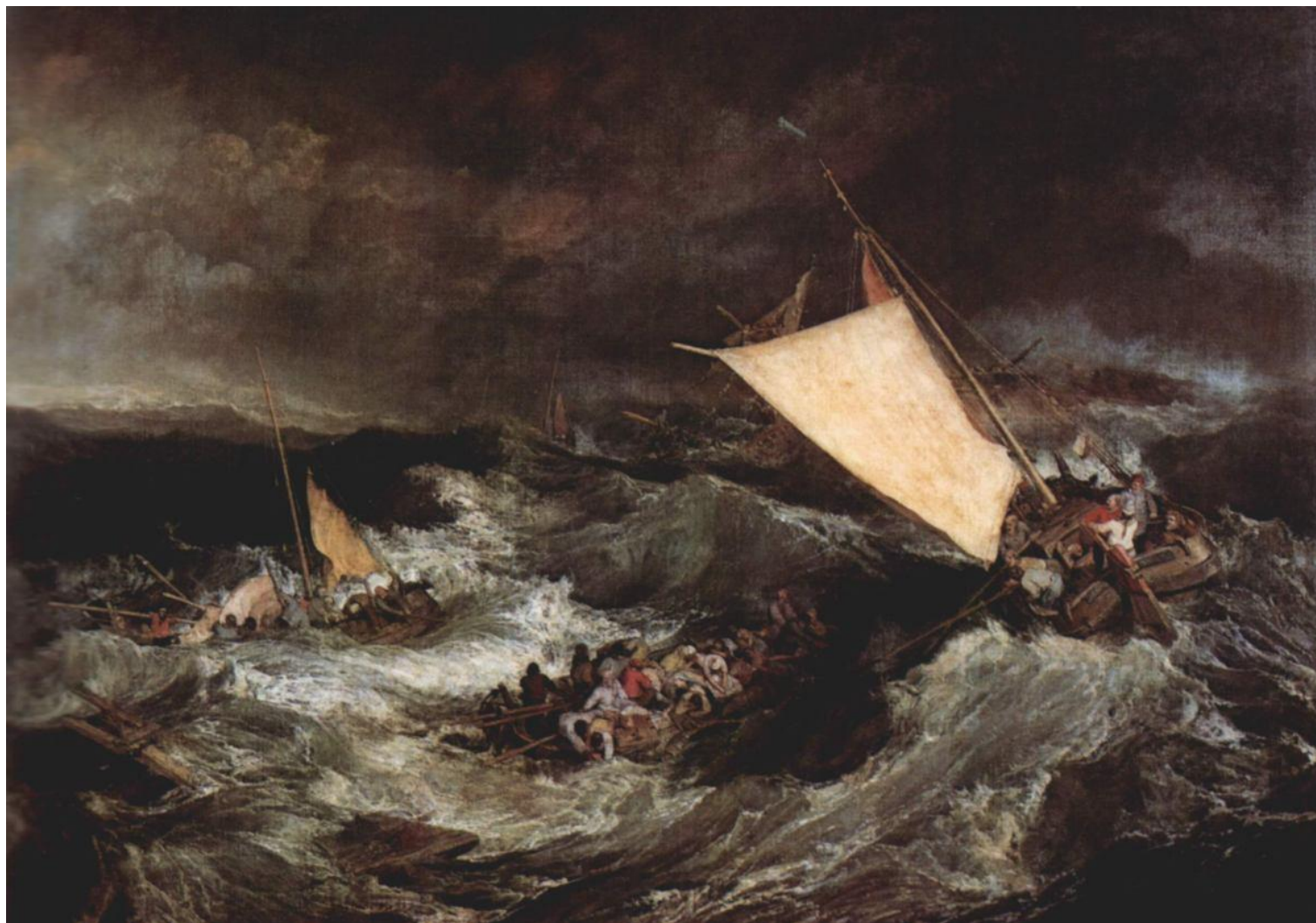
Кораблекрушение. 1805 г.