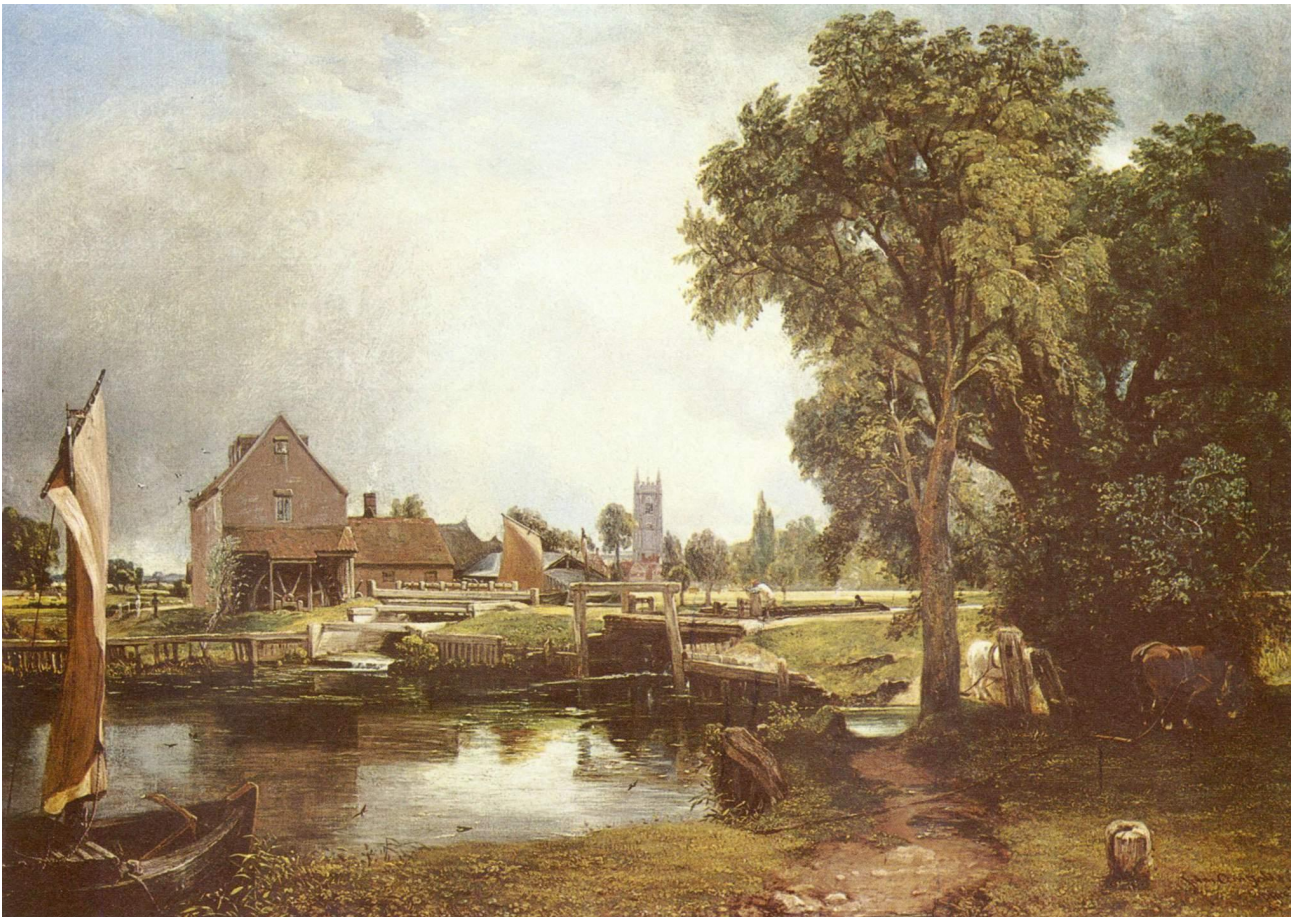
«Плотина и мельница в Дедхеме» (1820 г.)