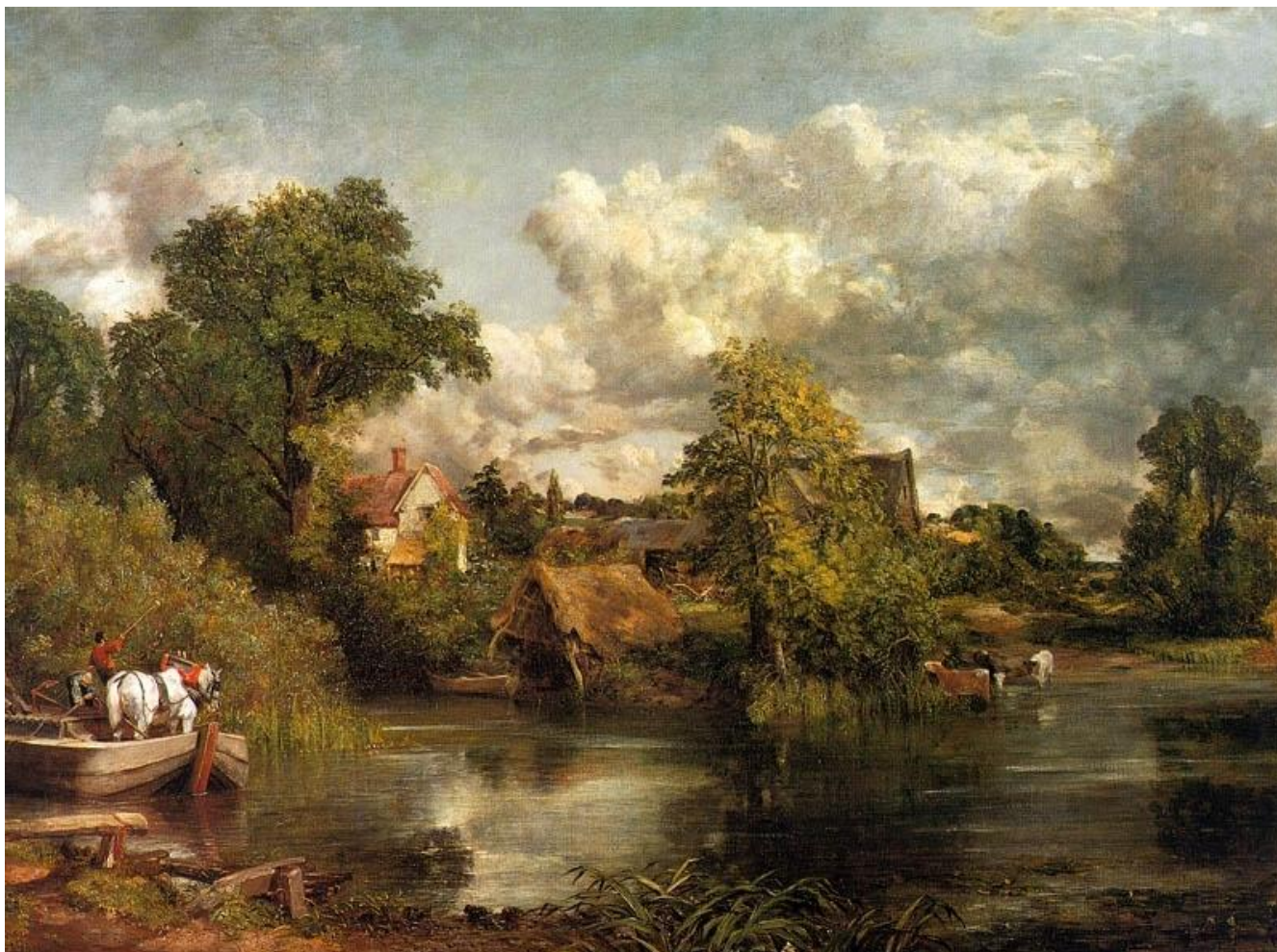
«Белая лошадь» (1819 г.)