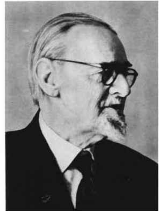
Николай Александрович БЕРНШТЕЙН (1896—1966)