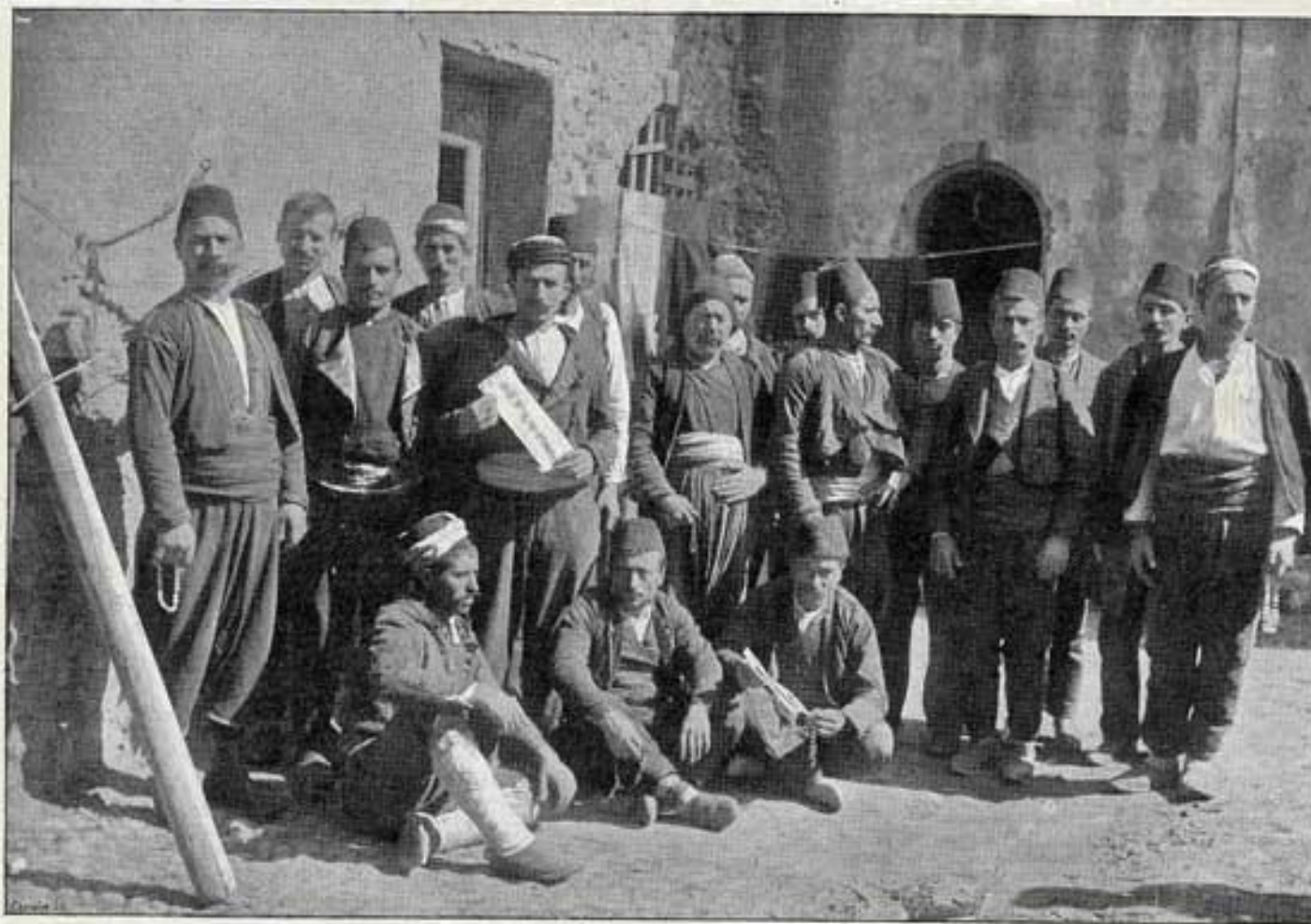
Armeniens ayant pris part à l'attaque de la Banque ottomane de Constantinople. D'après une photographie faite par M. J. Fabre à leur arrivée à Marseille.