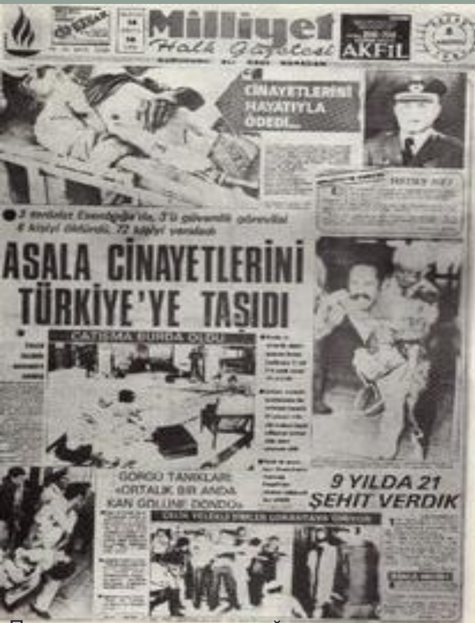
Передовая статья турецкой газеты «Миллиет», посвященная теракту АСАЛА в анкарском аэропорту «Эсенбога»