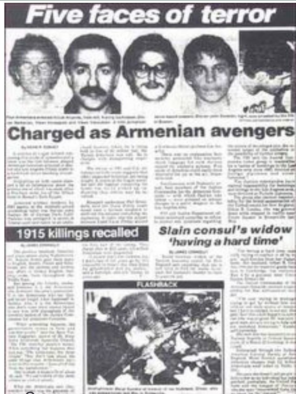
Отрывок из газеты о розыске армянских террористов