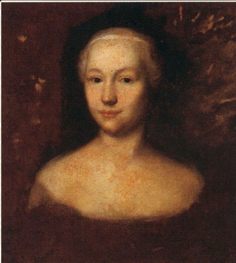
Портрет Анны Леопольдовны