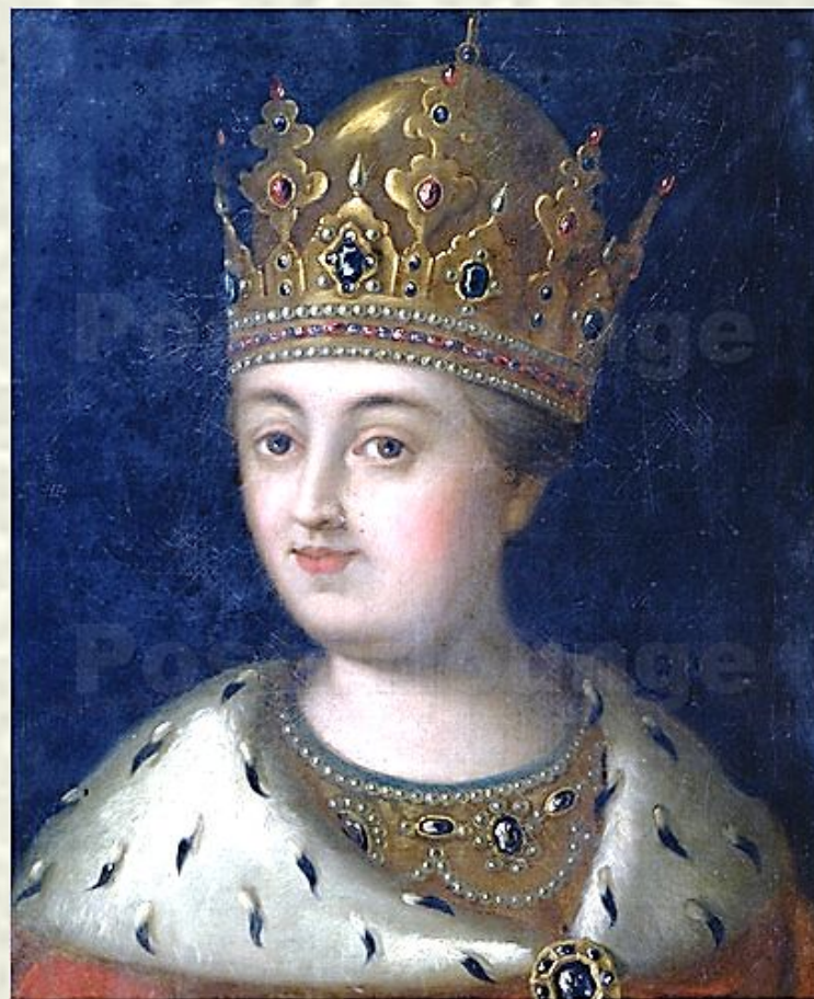
Портрет царицы Софьи