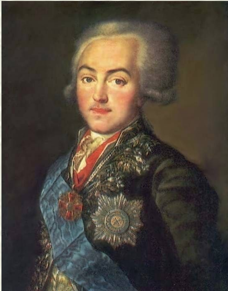
«Портрет графа Н. П. Шереметева»..