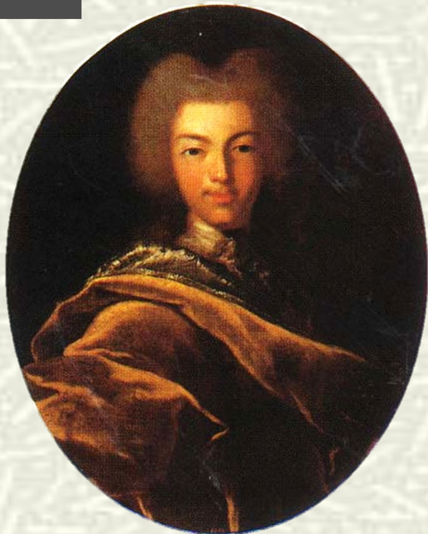
Портрет Петра Второго