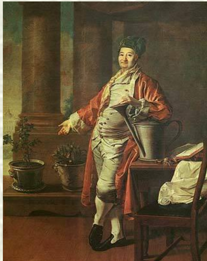
«Портрет П. А. Демидова». 1773 год.