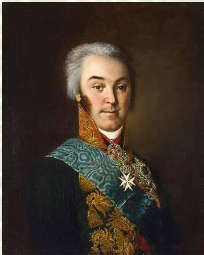
Портрет Н.П. Шереметьева