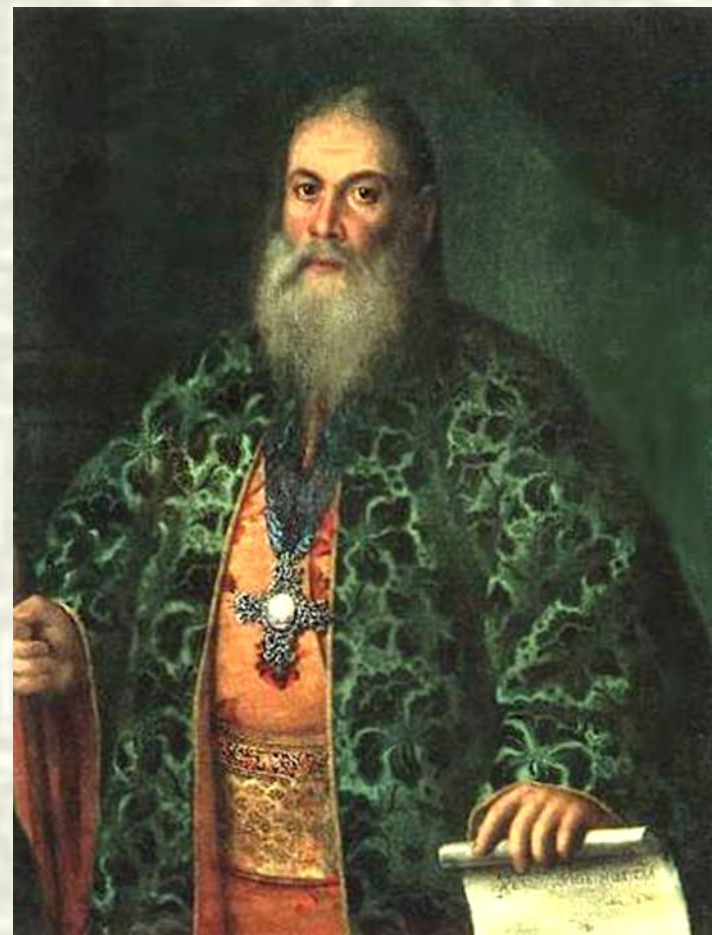
Портрет Ф.Я. Дубянского