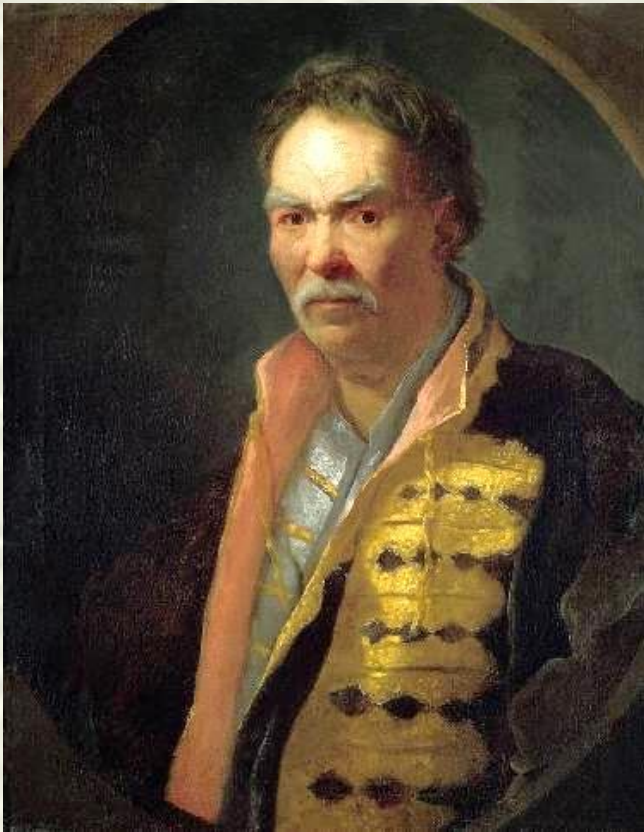
Портрет напольного гетмана