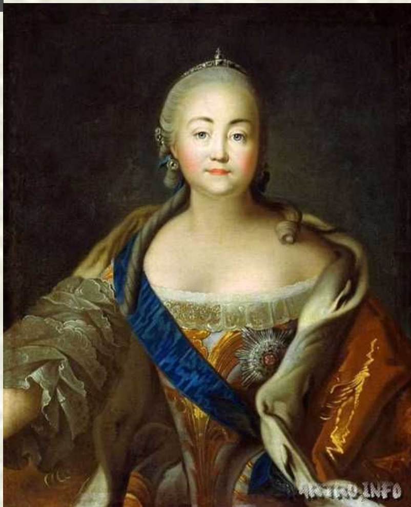
Портрет Елизаветы Петровны.