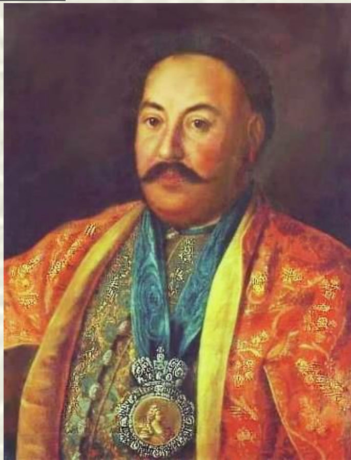
Портрет атамана Ф. Краснощекова.