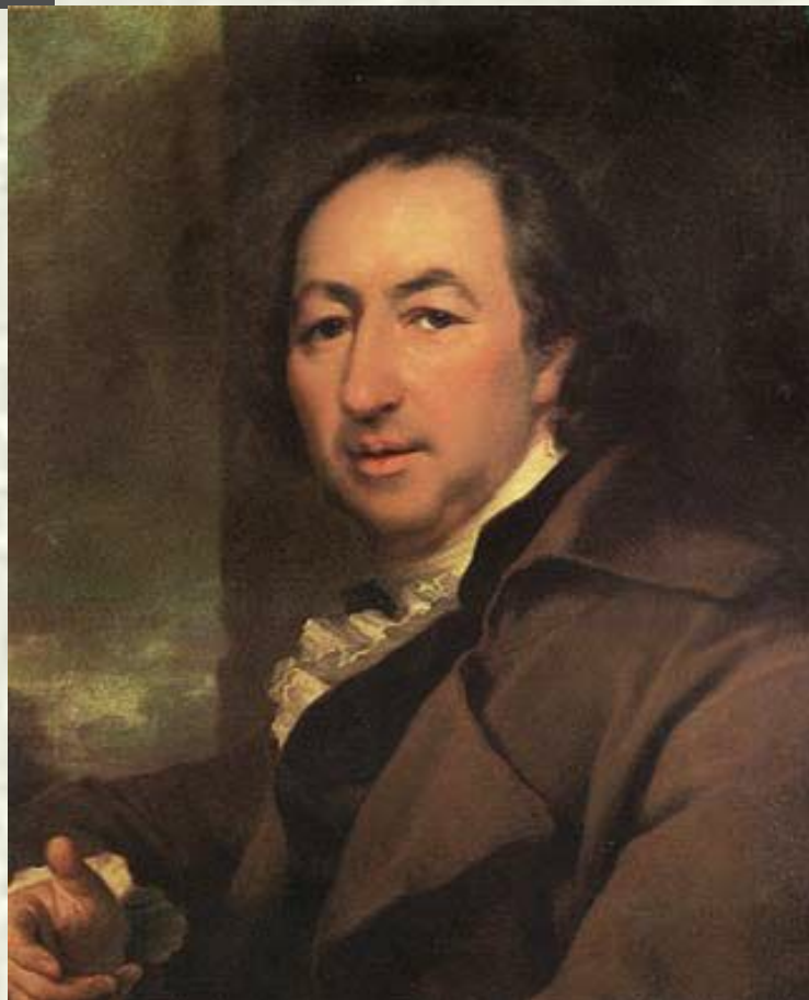
«Портрет писателя Н. И. Новикова». 1797 год