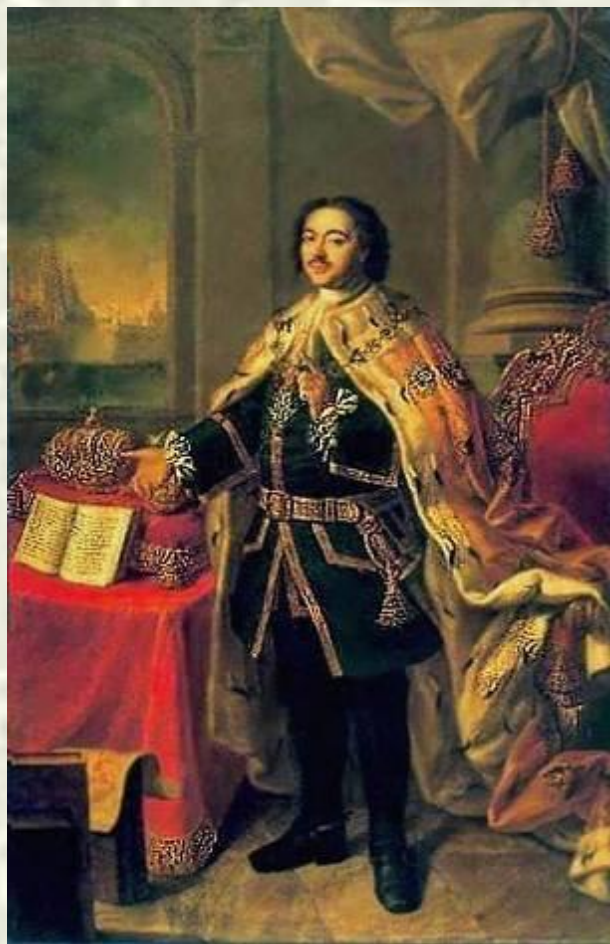
Портрет императора Петра I