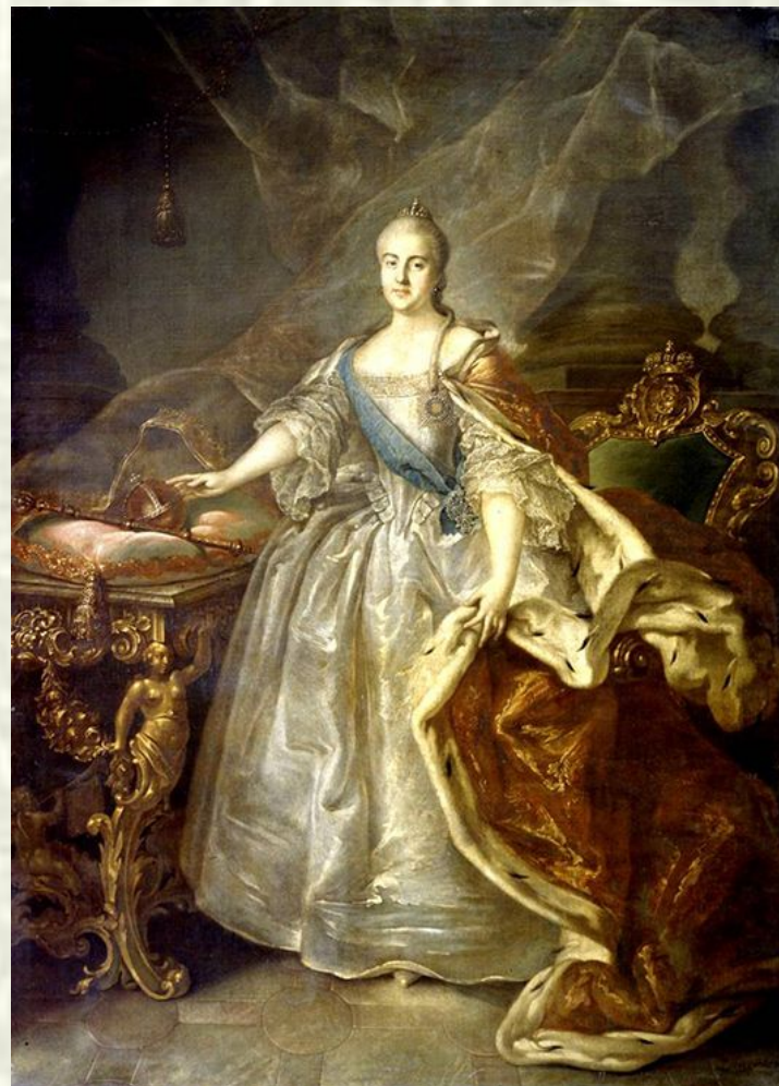
Портрет Екатерины Великой.