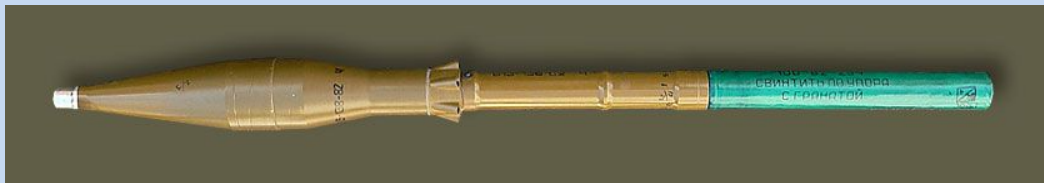
Выстрел ПГ-7ВС с гранатой ПГ-7С