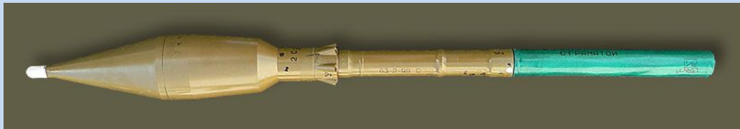
Выстрел ПГ-7ВЛ "Луч" с гранатой ПГ-7Л