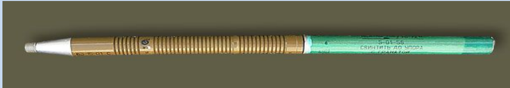
Выстрел ОГ-7В "Осколок" с гранатой ОГ-7