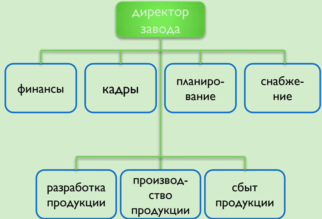
Схема линейно-функциональной организации