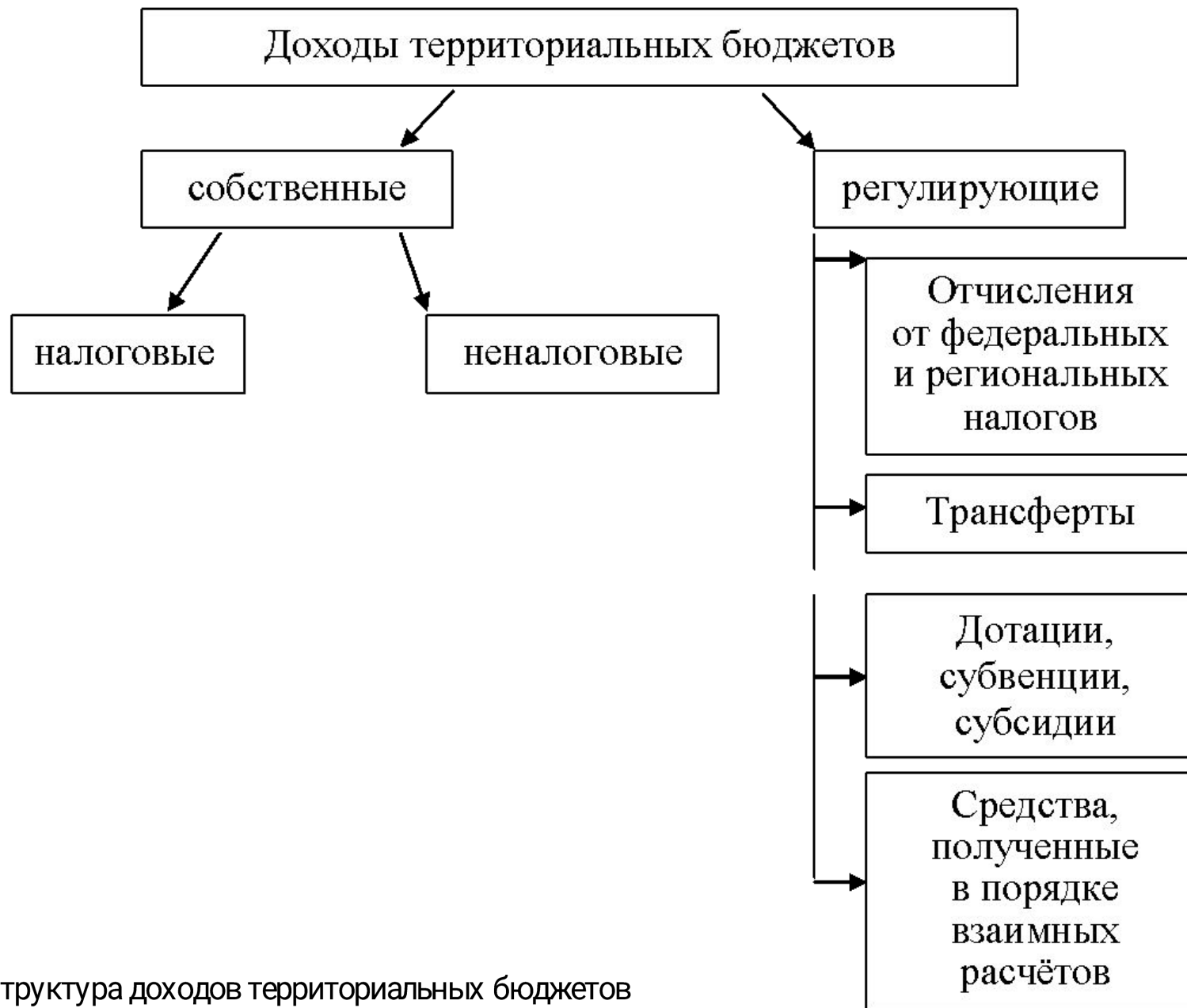
Рис. 1. Структура доходов территориальных бюджетов