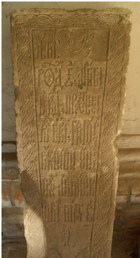
Надгробие 1666 года