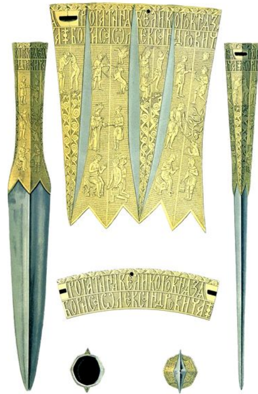
Вязь на рогатине