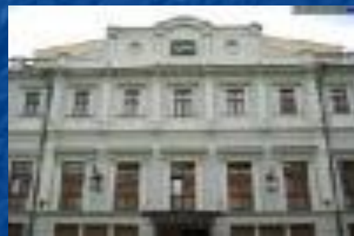
Худ. рук. Олег Табаков