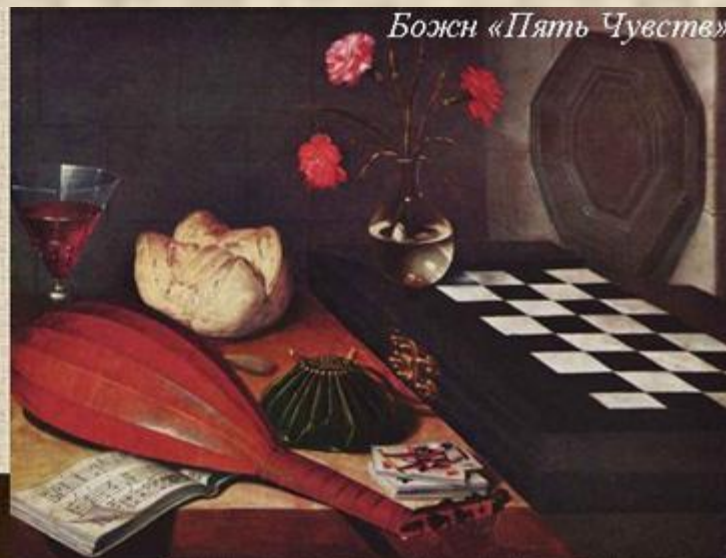
Баскенис «Музыкальные инструменты»