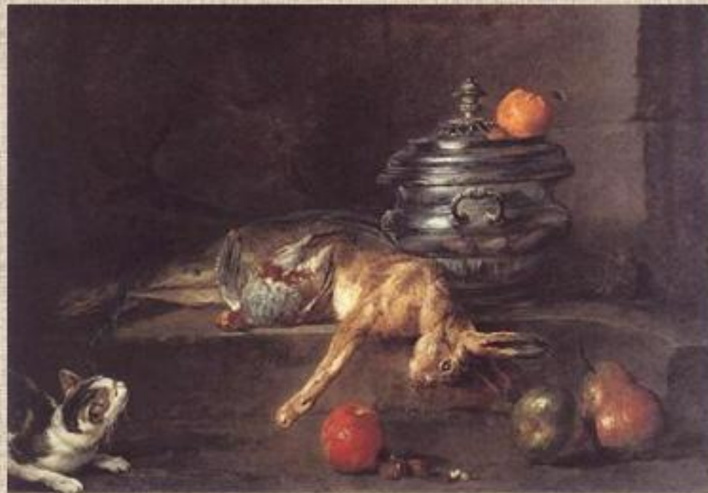
Шарден «Натюрморт с серебряной вазой»

Но чаще этот зверек ассоциируется с тёмными силами и магией