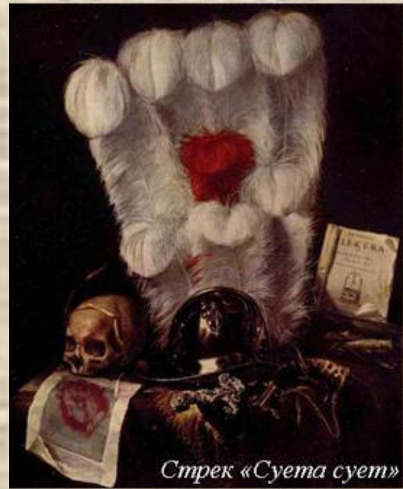
Стрек «Суэта суэт»