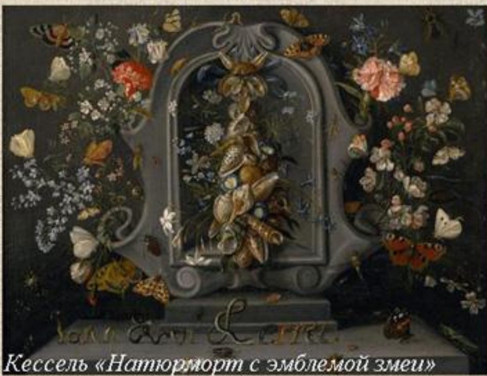
Кессель «Натюрморт с эмблемой змеи»

Излюбленным анималистическим сюжетом стало изображение змеи, хватающей бабочку (зло поглощает надежду)