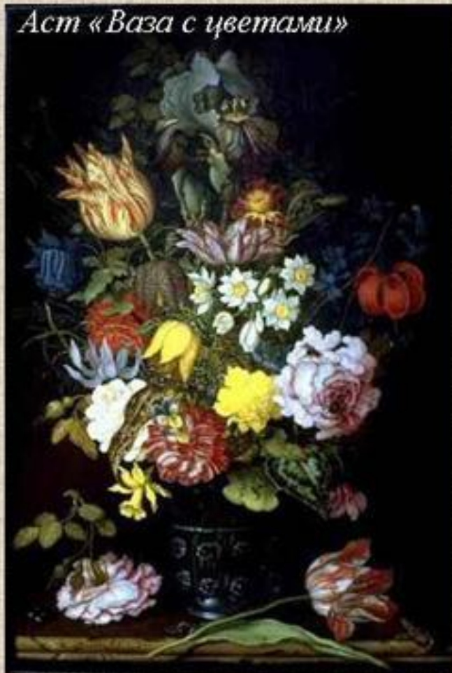
Аст «Ваза с цветами»

Внизу , возле вазы, обычно расположены знаки бренности — сломанные или увядшие цветы, осыпавшиеся лепестки, пустые раковины, гусеницы, мухи