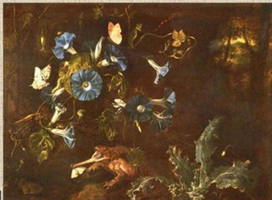
Шрик «Голубые выюнки, жаба и насекомые»

Змея- символ коварства и зла. Мыши, лягушки, дьявольские животные, часто изображались вместо змей