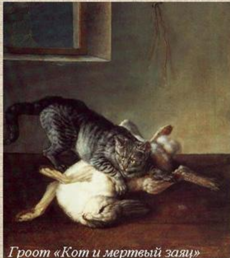
Гроот «Кот и мертвый заяц»

В Новое время кошка, подцепившая когтями большой кусок мяса, устойчиво напоминала о плотских наслаждениях