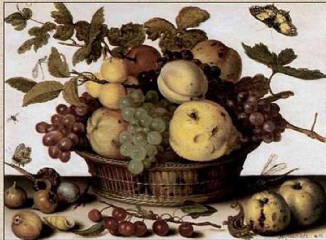
Аст «Корзина с фруктами»