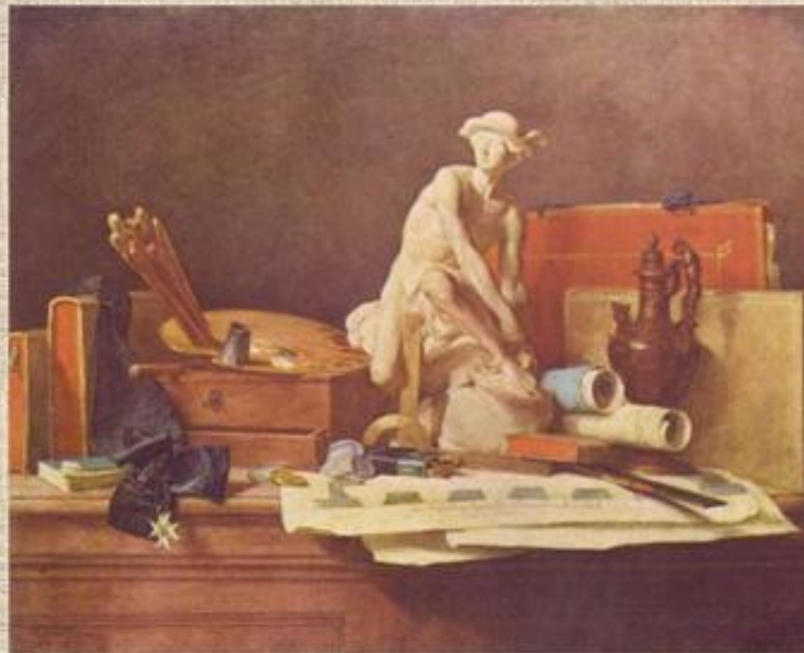
Шарден «Натюрморт с атрибутами искусств»

Часто это мифологические персонажи. Разувающийся Меркурий – символ успокоения от суетных земных забот