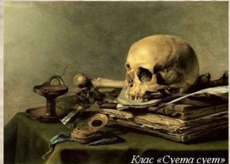
Клас «Суэта суэт»