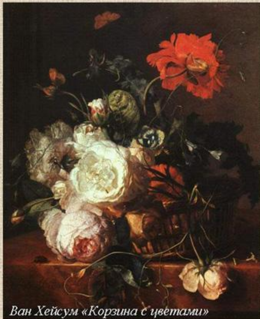
Ван Хейсум «Корзина с цветами»

Роза, цветы полевые, насекомые являются традиционным символом короткого человеческого существования