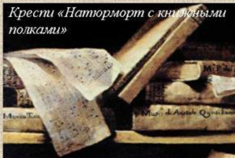
Крести «Натюрморт с книжными полками»

Россыпи старых книг означают уже ушедшее время