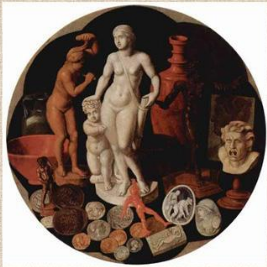
Терборх «Натюрморт с коллекцией раритетов»

В поздние натюрморты иногда попадает мелкая скульптура.