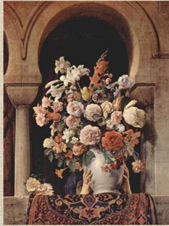
Хайес «Окно гарема»