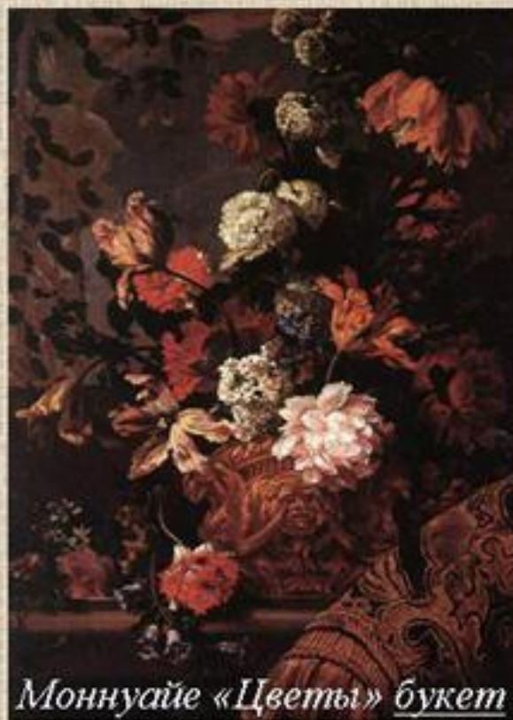
Моннаусайе «Цветы» букет

Цветочные натюрморты разделялись на «гирлянды» и «букеты». Гирлянда оборачивающаяся вокруг центрального изображения напоминала известный символ вечности - змею, обвившуюся вокруг крылатых часов. Потому и композиции такие имели прославительное значение