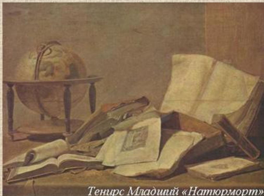
Тенирс Младший «Натюрморт»