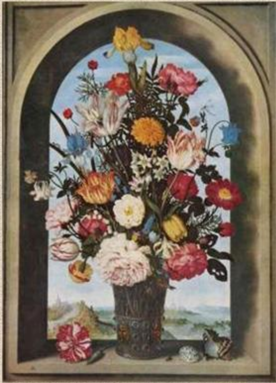
Босхерт Старший «Ваза с цветами в оконном проёме»