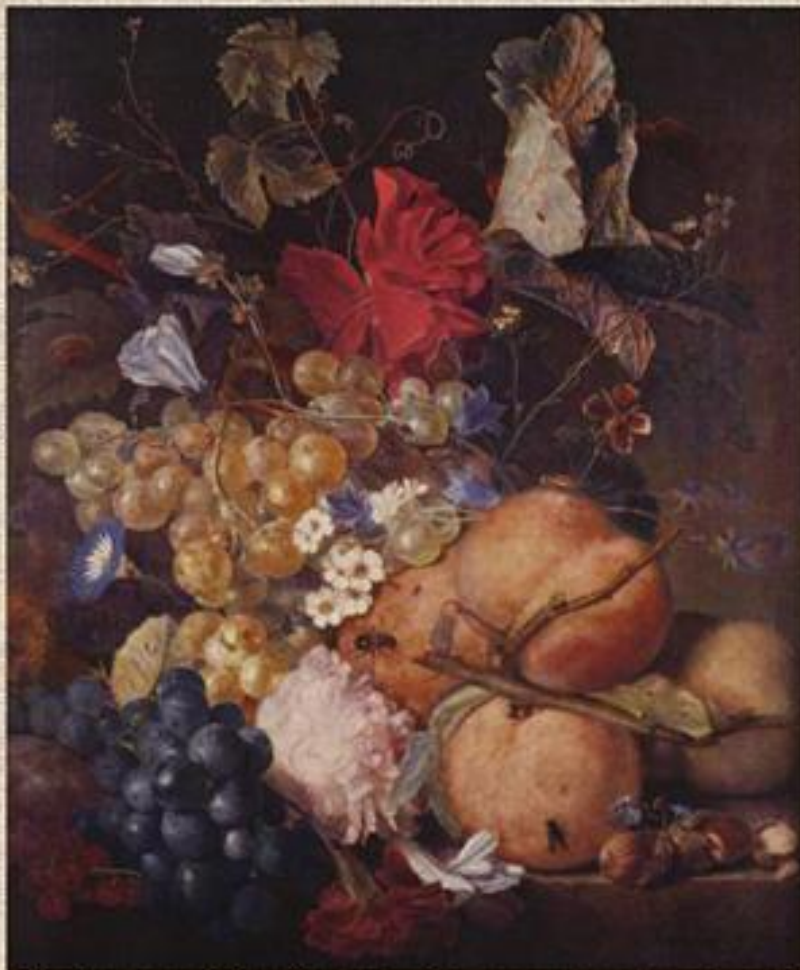
Хейсум «Плоды, ягоды и насекомые»

Иногда листья цветов изъедены насекомыми; рядом пустые раковины и орехи.