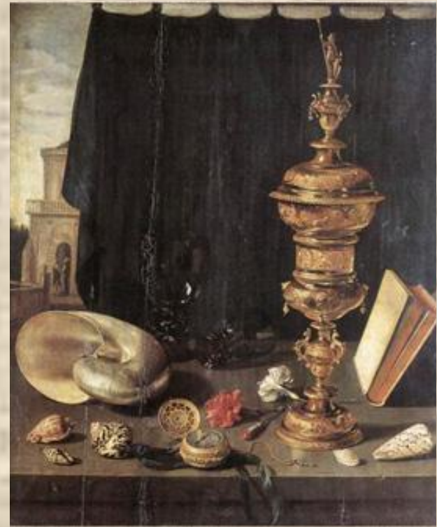
Клаф «Натюрморт с большим золотым кубком»