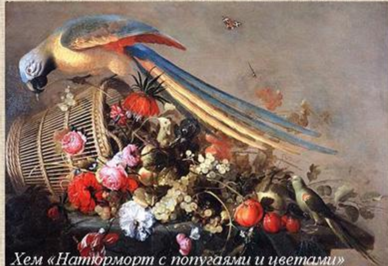
Хем «Натюрморт с попугаями и цветами»

Попугай символизировал праведность, красноречие, благодарность, или обозначал верующего