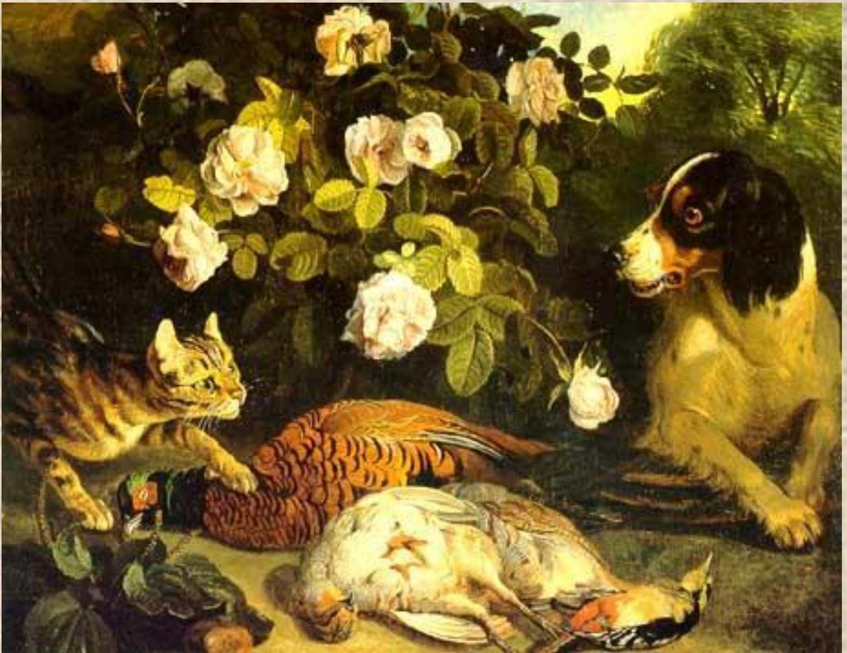
Франсуа Депорт. Собака, сторожащая охотничьи трофеи