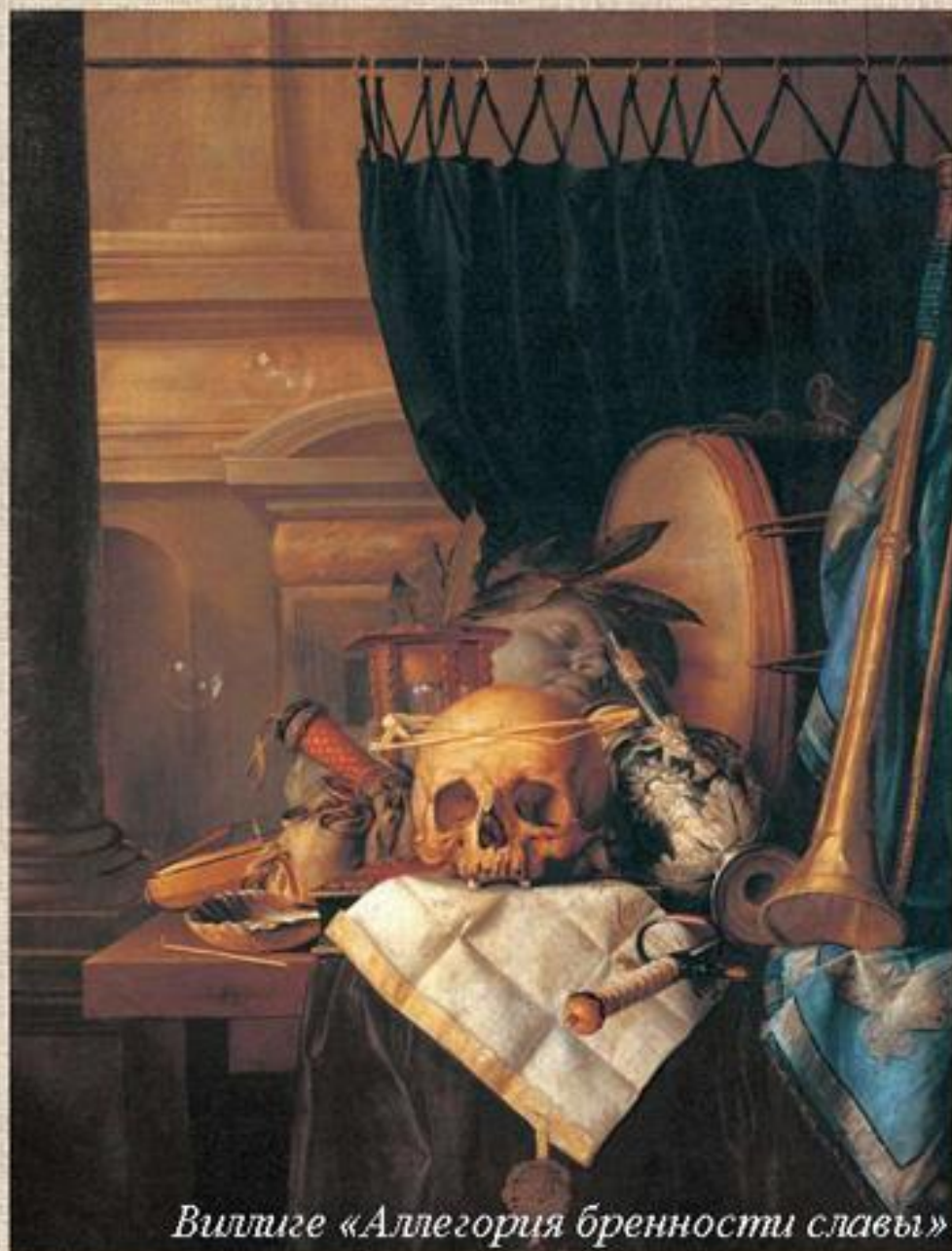
Виллиге «Аллегория бренности славы»

Человеческая жизнь уподобляется неверным тончайшим пузырям