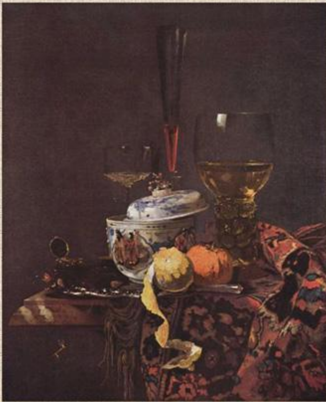
Клаф «Натюрморт с китайской миской»