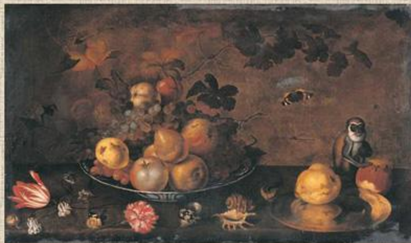
Бауман «Цветы фрукты и обезьяна»

Обезьяна – изображение пороков, грешника и даже дьявола