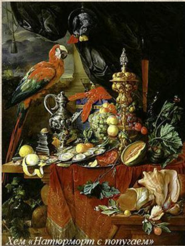
Хем «Натюрморт с попугаем»

Попугай символизировал праведность, красноречие, благодарность, или обозначал верующего