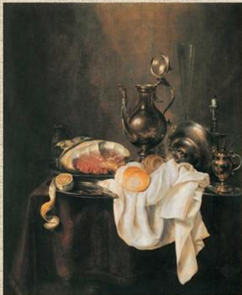
Хеда «Ветчина и серебряная посуда»