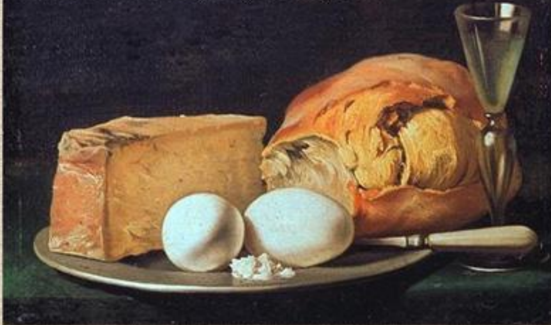
Мелендес «Натюрморт с яйцами»