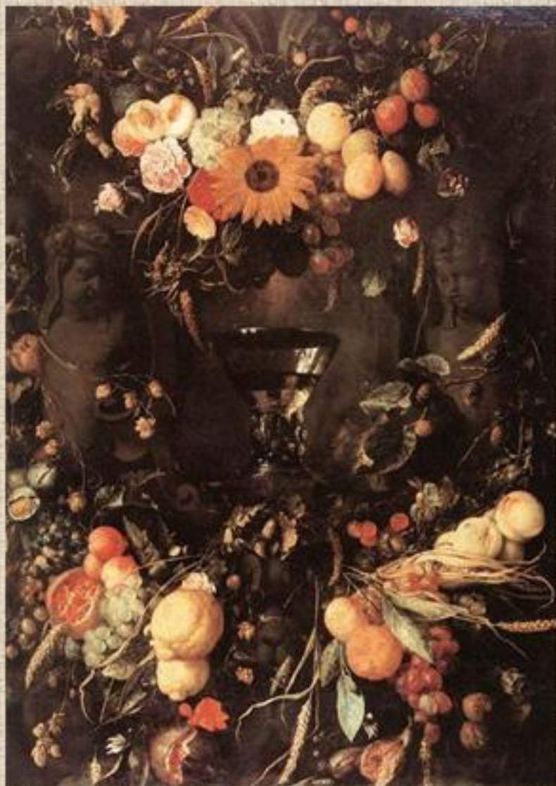
Хем «Фрукты и цветы»

Символы времен года: цветы – весну, колосья и фрукты - лето, виноград - осень, лимоны- зима (всё меняется, неизменной остаётся лишь добрая память)