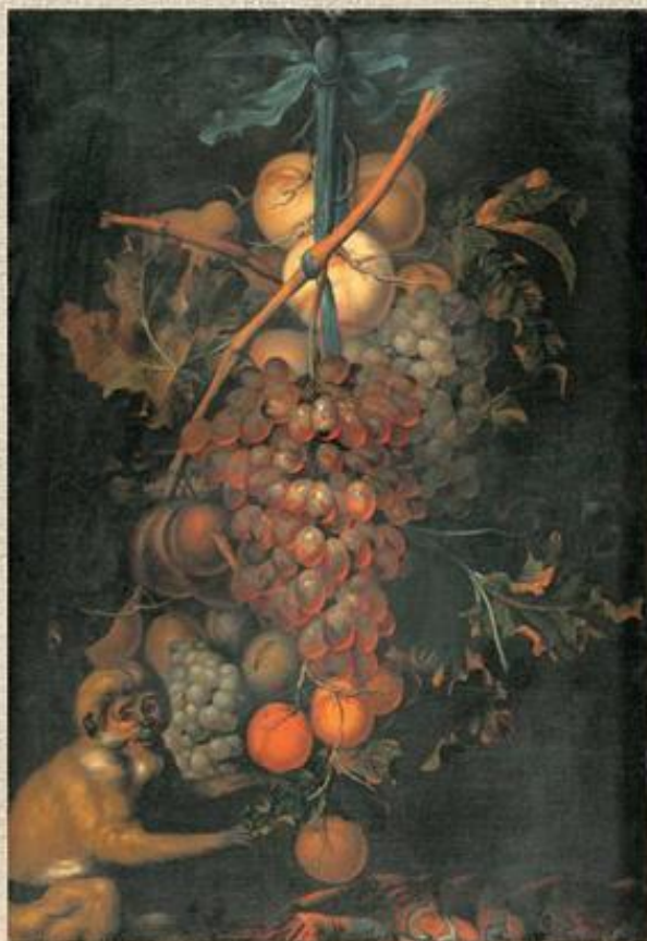
Хем «Аллегория вкуса (осень)»

Обезьяна – изображение пороков, грешника и даже дьявола