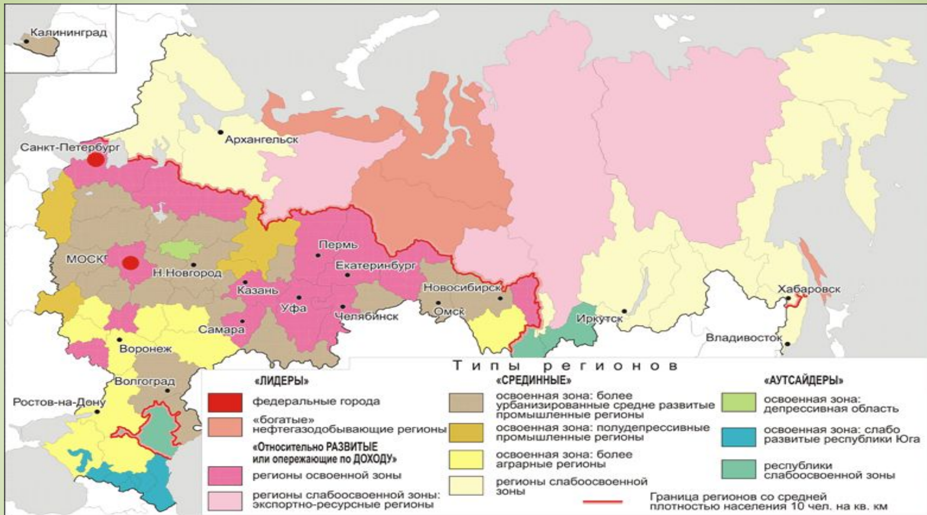
Социально-экономические типы регионов, 2010 г.

Полученная типология показывает, что для России нужна социальная политика, адаптированная с учетом особенностей как минимум шести разных типов регионов.