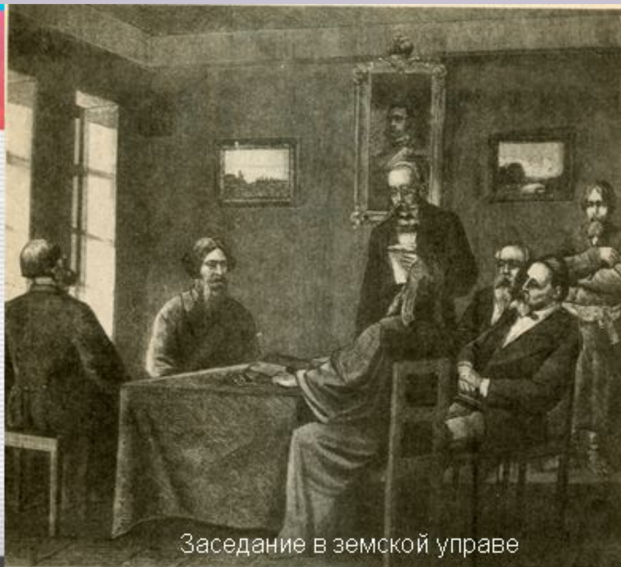
Заседание в земской управе