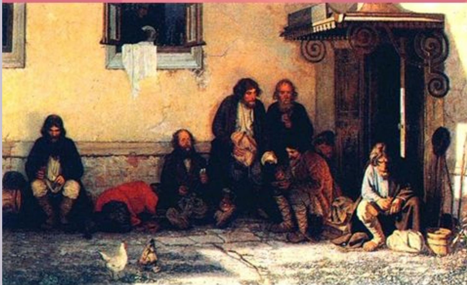
Г.Мясоедов. «Земство обедает»