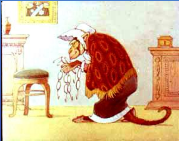
И.А.Крылов Мартышка и очки

Малый эпический жанр, основанный на иносказании, или аллегории. Состоит из 2 частей: повествовательной и поучительной (мораль).