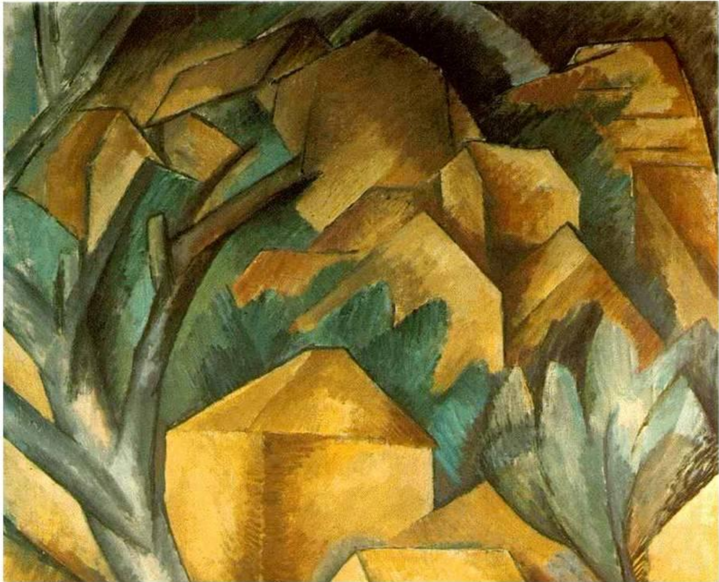
Жорж Брак. Дома в Эстаке, 1908