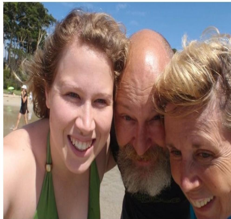
Второе фото. На пляже, ориентировочно 2010 год.

«Я тогда не верил, что всё случится так быстро. Сестра плакала, а мама говорила, что всё хорошо, на всё воля Божья. А потом начался настоящий сюрреализм. Начались ухудшения – шаг за шагом. С появлением всё новых нарушений. Паранойя, забывание имен, утрата навыка самостоятельного приёма пищи».