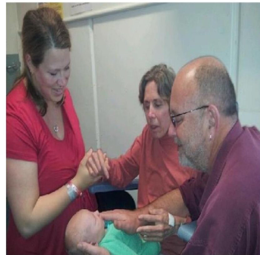
Пятое фото. Рождение первого внука – событие, которого она ждала долгие годы.

«Наш отец – очень сильный человек, умеющий держать удар. Целыми днями он ухаживает за ней и говорит, что главное – сохранить чувства, делать всё, что в твоих силах, и принять ситуацию такой, какая она есть».