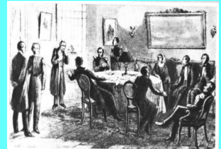
Редакция журнала «Современник»