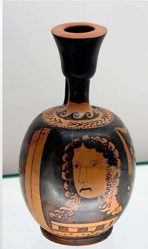
Рис.2 Греческая театральная маска