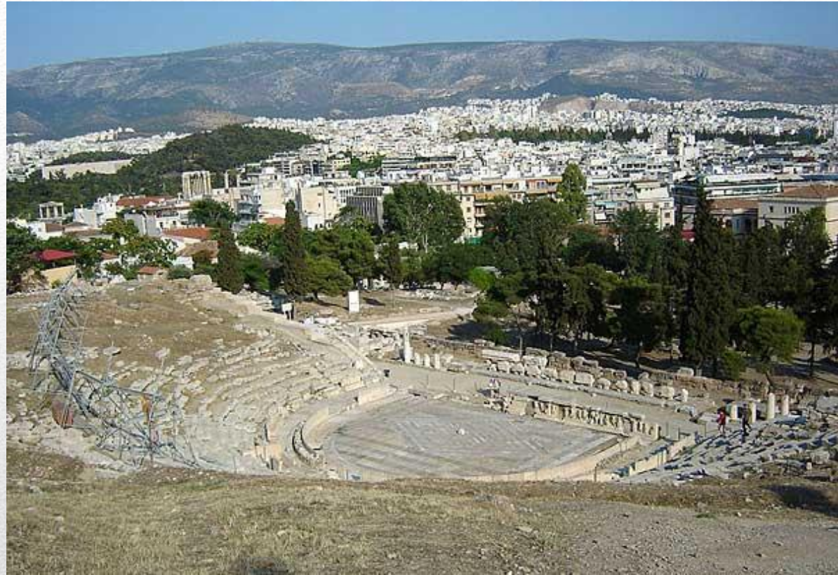
Рис.3 Развалины театра Диониса в Афинах в настоящее время