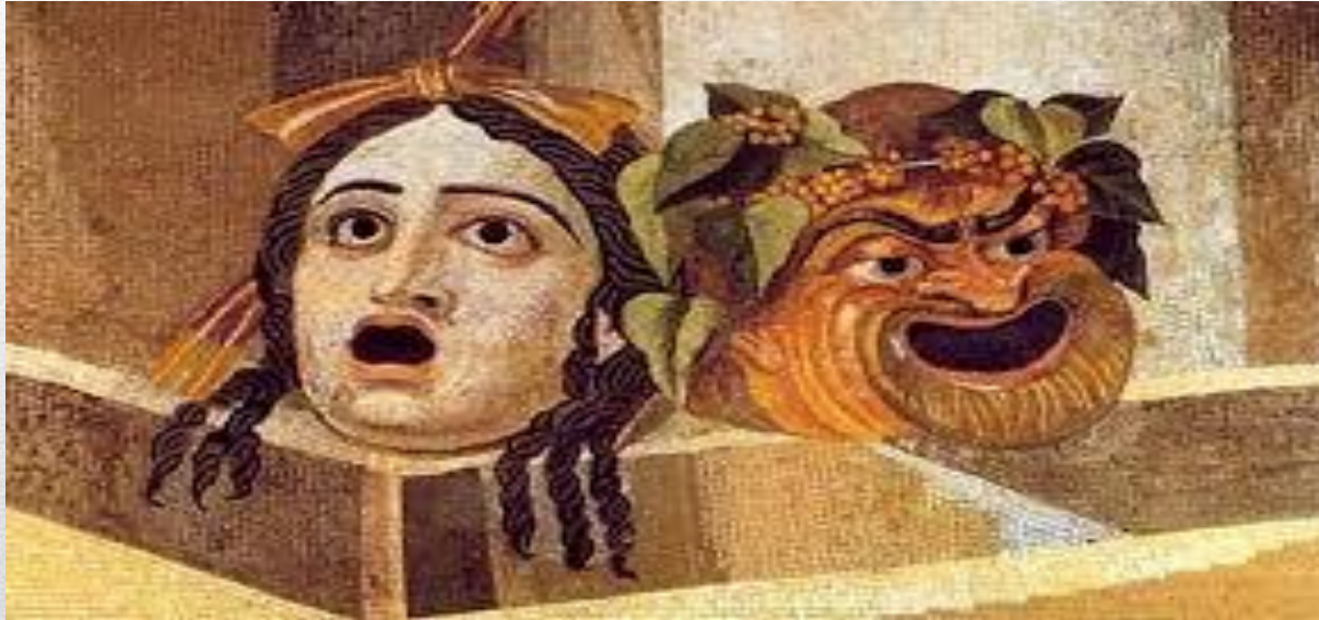
Рис.4 Греческие маски: Трагедия и Комедия