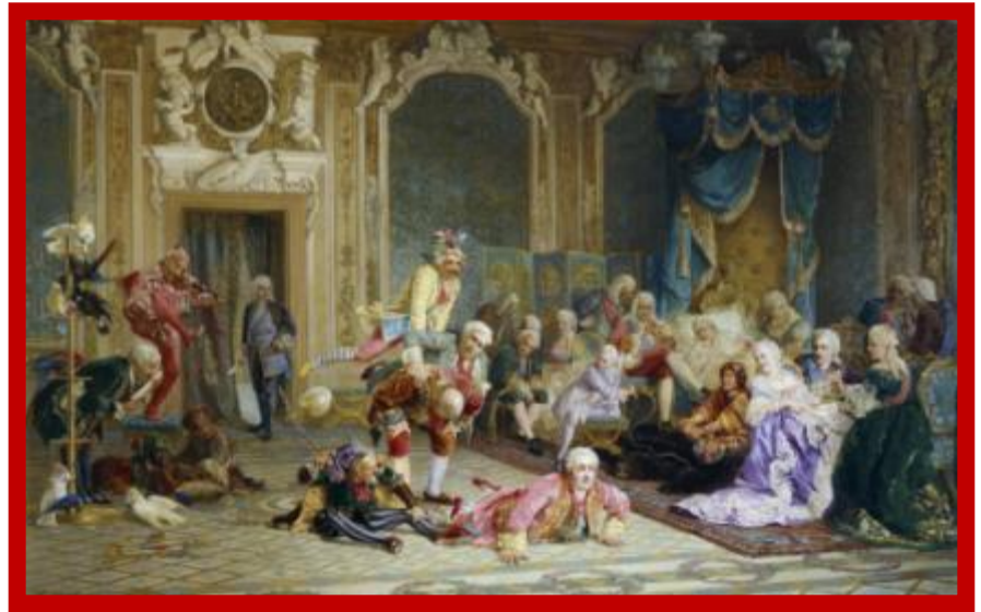
Якоби Валерий Иванович. Шуты при дворе императрицы Анны Иоанновны.

1730-1740 гг. - правление Анны Иоанновны Племянница Петра I, вышедшая замуж за герцога Курляндского, прозвище «Кровавая», «Митавская затворница».