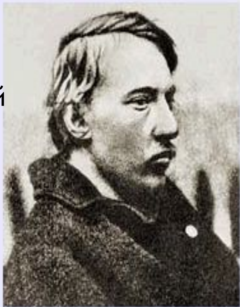
Д. Н. Каракозов.

КАРАКОЗОВ Дмитрий Владимирович (1840-66), российский революционер,. 4 апреля 1866 неудачно покушался на императора Александра II. Повешен.