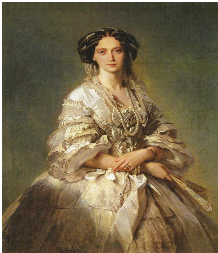
императрица Мария Александровна 1824-1880 гг.