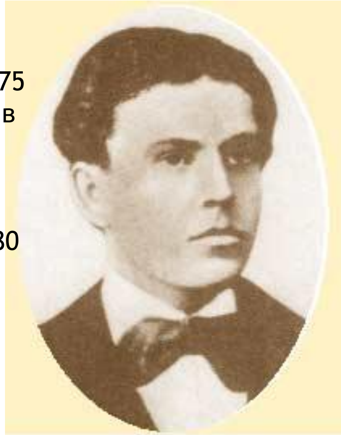
Гриневицкий Игнатий Иоахимович (1856 – 1881)

1.3.1881 Александр II был убит взрывом бомбы, брошенной Гриневицким, при этом погиб и сам террорист.