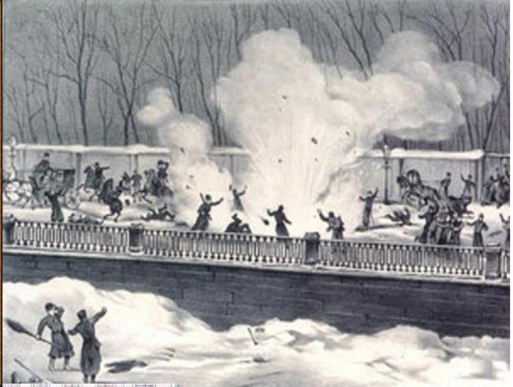
Czar Alexander II murdered by Jewish extremists . . .