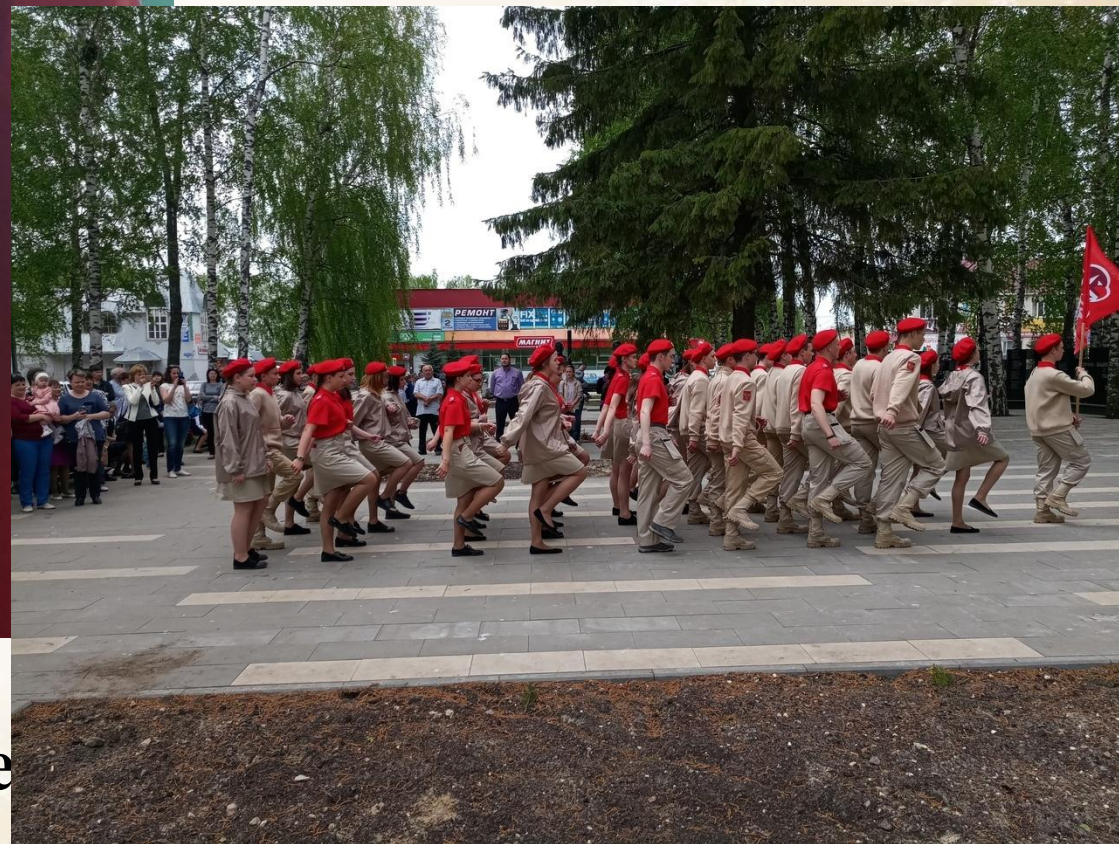
Занятия по строевой подготовке