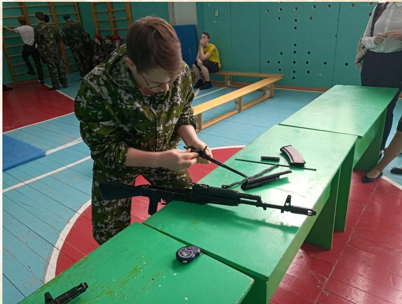
Занятия по военной подготовке.