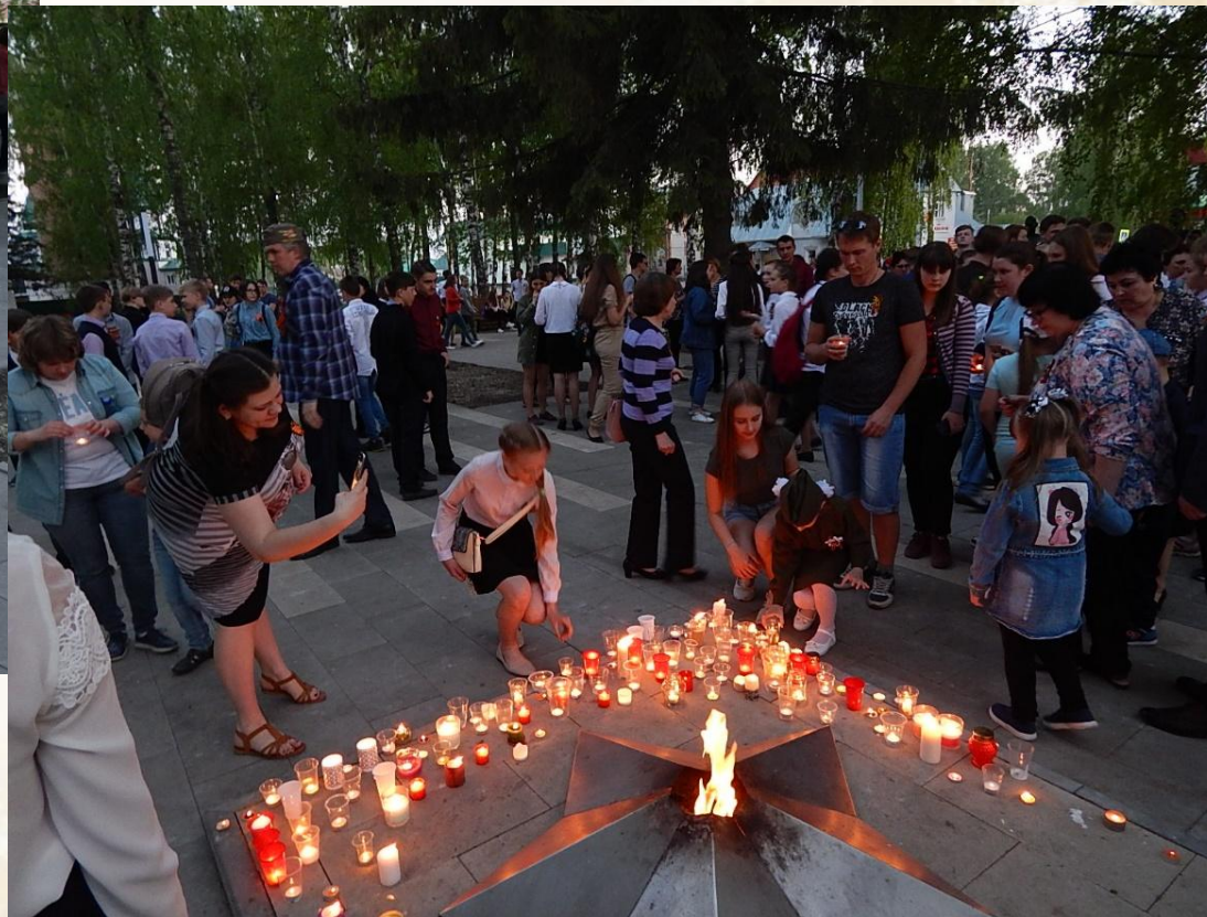
Акция «Зажгите свечи!»