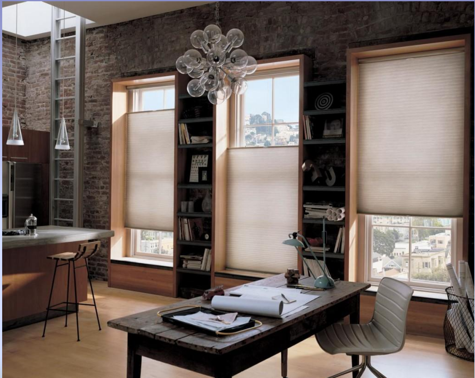
three large windows