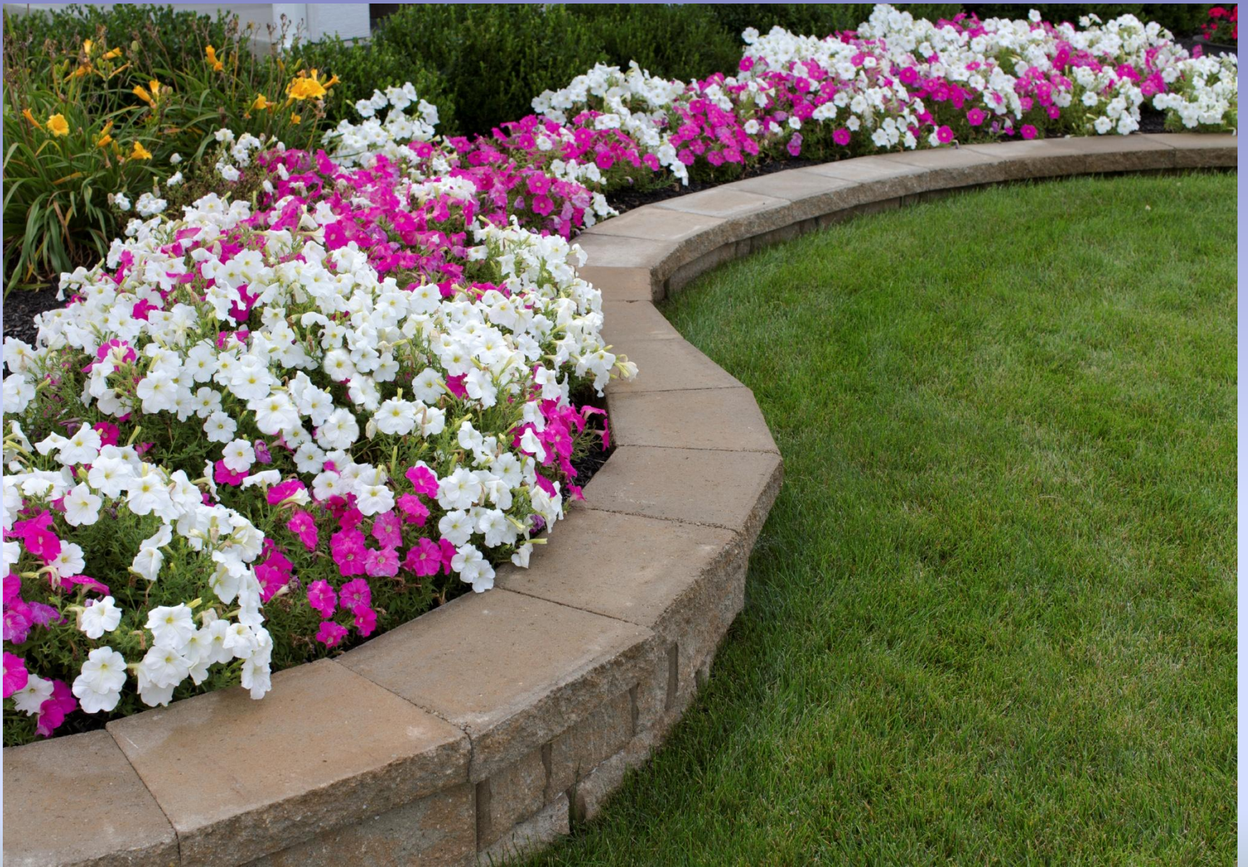
a green lawn with flower-beds in front of it.