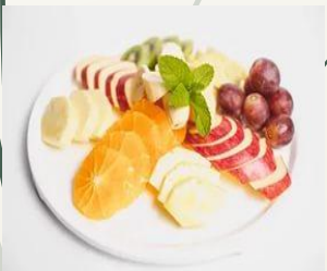
Фруктовая нарезка (Яблоко, груша, банан, апельсин, виноград)