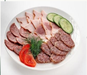
Мясное ассорти (сервелат, сыро-копченая колбасы, ветчина, куриный рулет)