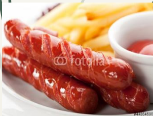
Колбаски Охотничьи (Свинина, говядина, мясо птицы, соль, специи)