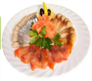
Рыбное ассорти (Скумбрия х/к, сельдь с/с, семга )