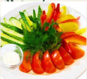
Овощная нарезка (Огурец, помидор, перец Болгарский)