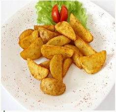
Картофель по Деревенски

(Картофель, маринад, специи, соль, масло)