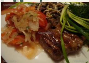
Свинные ребрышки запеченные

(Свинина- ребра, специи, соль, соевый соус, паприка молотая, соус Краснодарский, чеснок, масло)