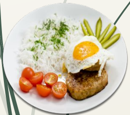
Биштекс по Гамбургски

(Свинина рубленая, специи, мука, яйцо, масло)