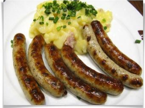
Колбаски Баварские (Свинина, говядина, специи, соевый соус)