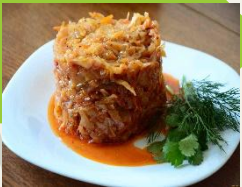
Капуста тушеная с овощами

(Капуста белокочанная, томат, лук, специи, масло)