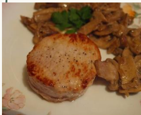
Медальоны из свинины

(Свинина мякоть, соль, специи, масло, соевый соус)