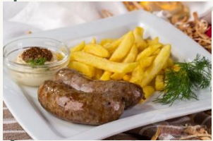
Колбаски Мюнхенские (Свинина, соль, специи, зелень)