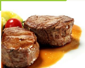
Медальоны из телятины

(Говядина вырезка, бекон, мука, специи, перец, томат, оливковое масло)