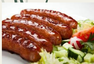
Гриллеры с сыром (Сосиски гриль, специи, масло)