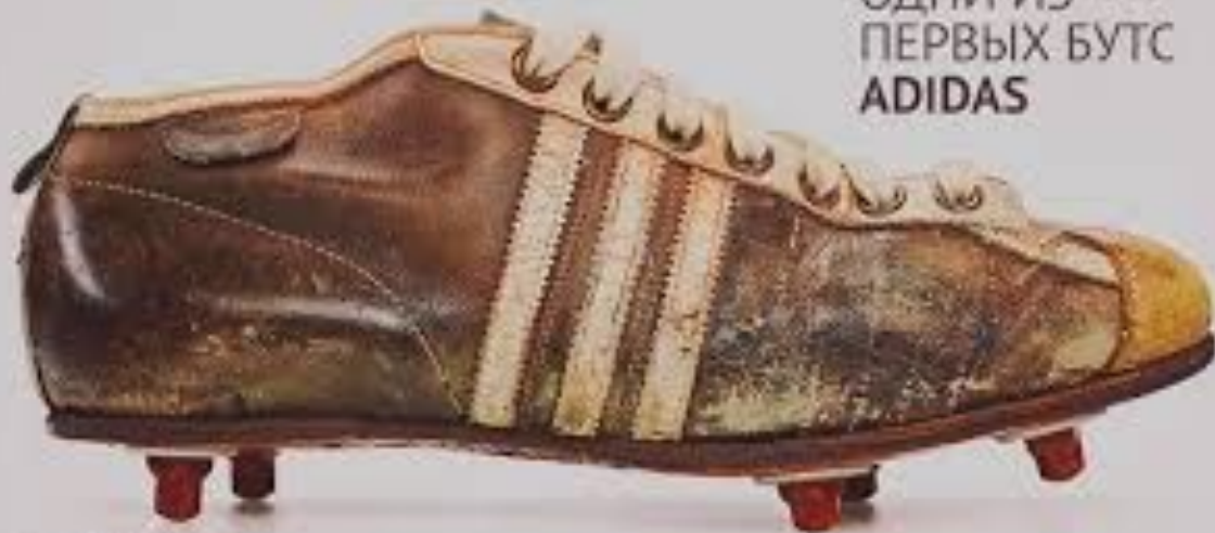
ОДНИ ИЗ ПЕРВЫХ БУТС ADIDAS