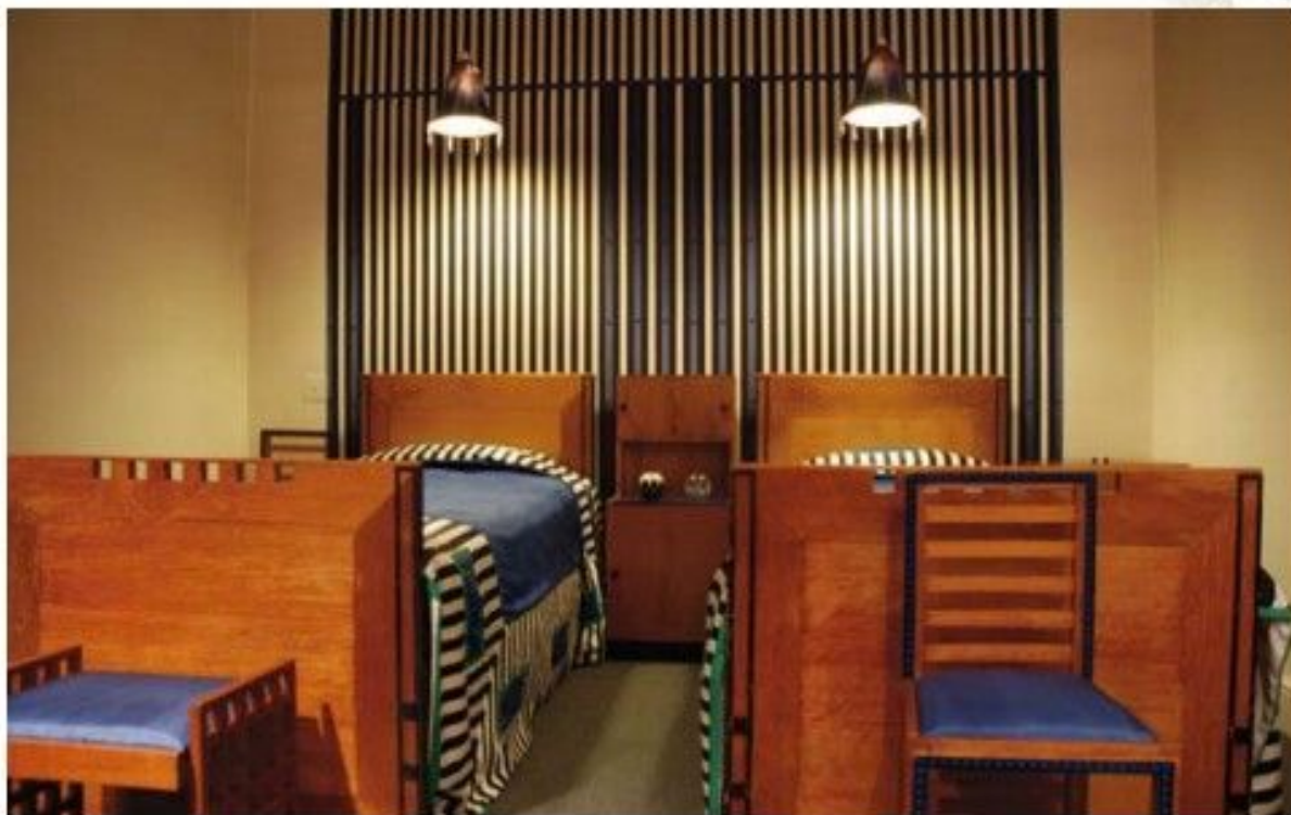
Ч. Макинтош. Спальная комната