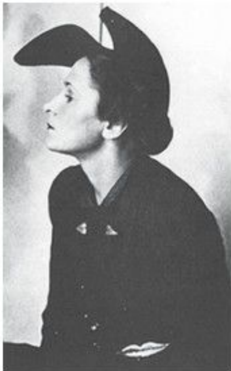
С. Дали. Идея шляпки в форме туфли