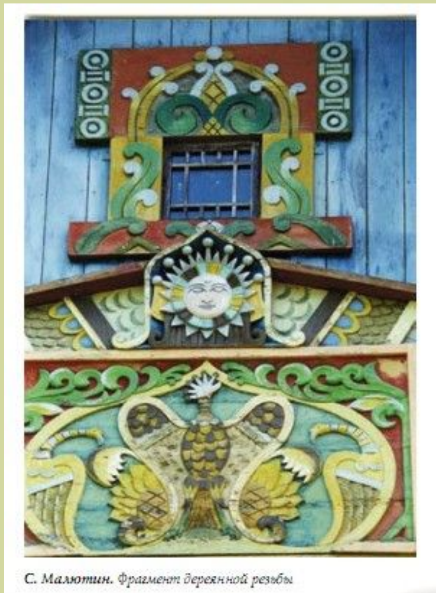
С. Малютин. Фрагмент деревянной резьбы