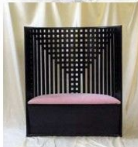
Ч. Макинтош. Софа