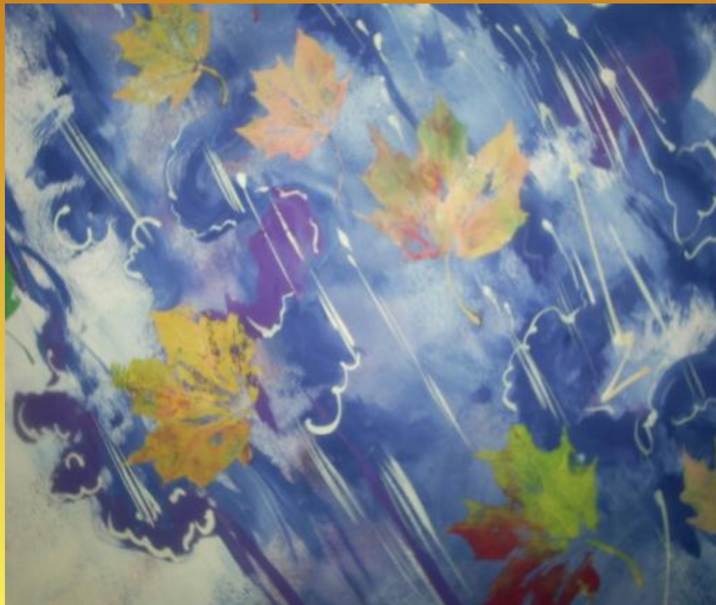
Рисунок фона «по - мокрому с солью» Рисование отпечатками «Разноцветные листочки» (в технике «эстамп»)