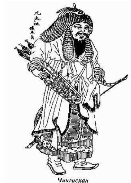
Чингисхан(Тэмүчжин) (1155 - 1227+)