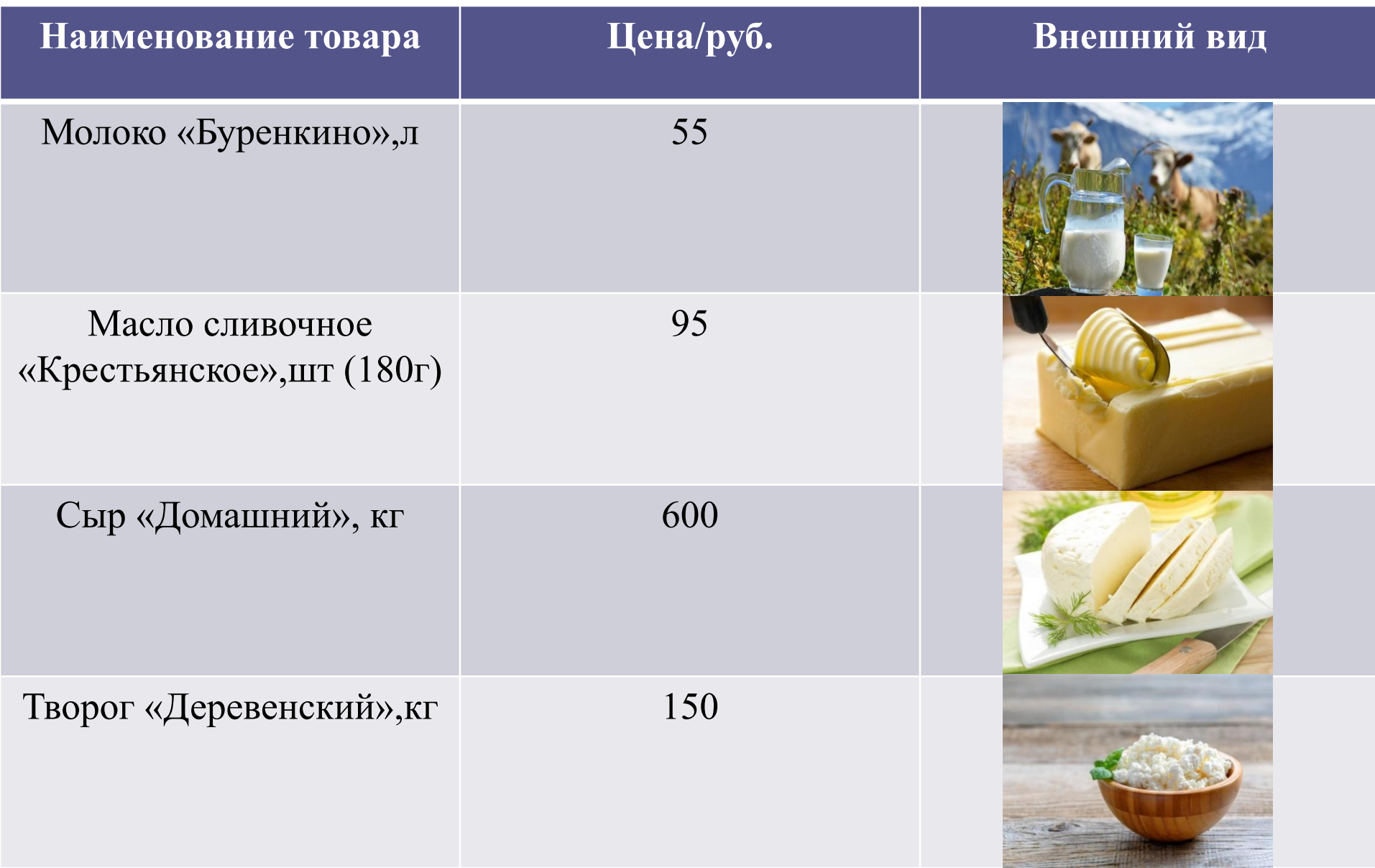
Таблица 1- Реализуемая продукция