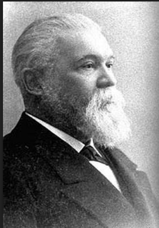
Николай Степанович Таганцев (1843 – 1923)