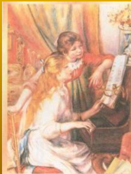
О. Ренуар. Девушки за пианино