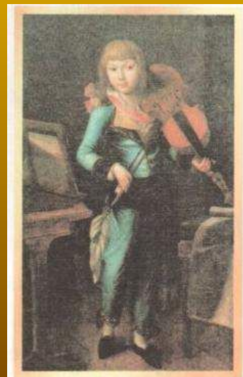
Неизвестный художник Мальчик со скрипкой