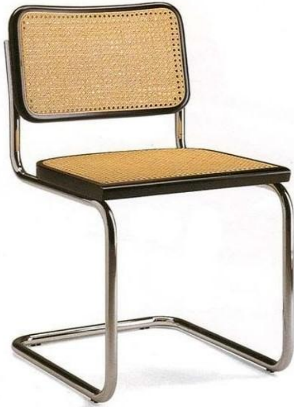
Марсель Бреуер, МВ-118 Стілець

Дизайнери усіх часів випробовували свої можливості на стільцях або кріслах.