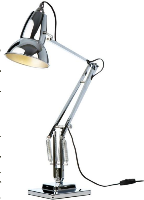
Джордж Карвадін, Anglepoise lamp

Головним гаслом тогочасних дизайнерів було – функціональність – це головне.