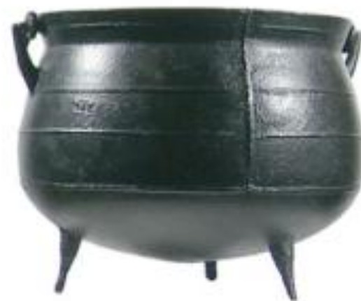
Абрахам Дербі, Казан

До початку промислової революції все робили ремісники. Всі вироби мали схожий дизайн, але кожний чимось відрізнявся.