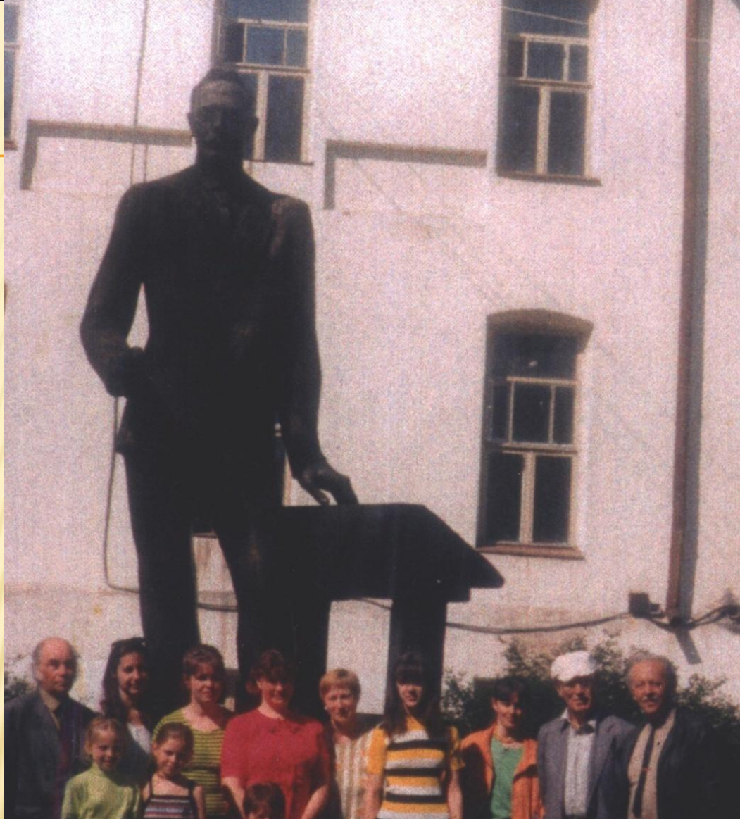
ВЕЛИКОЛУКСКАЯ ДЕЛИГАЦИЯ У ПАМЯТНИКА УЧИТЕЛЮ В ТОРОПЦЕ