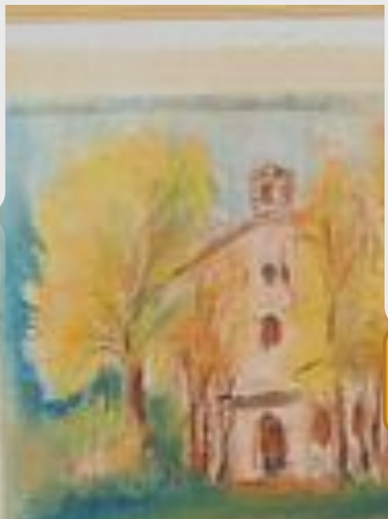
«Заброшенный погост Торопецкого уезда. Храм»