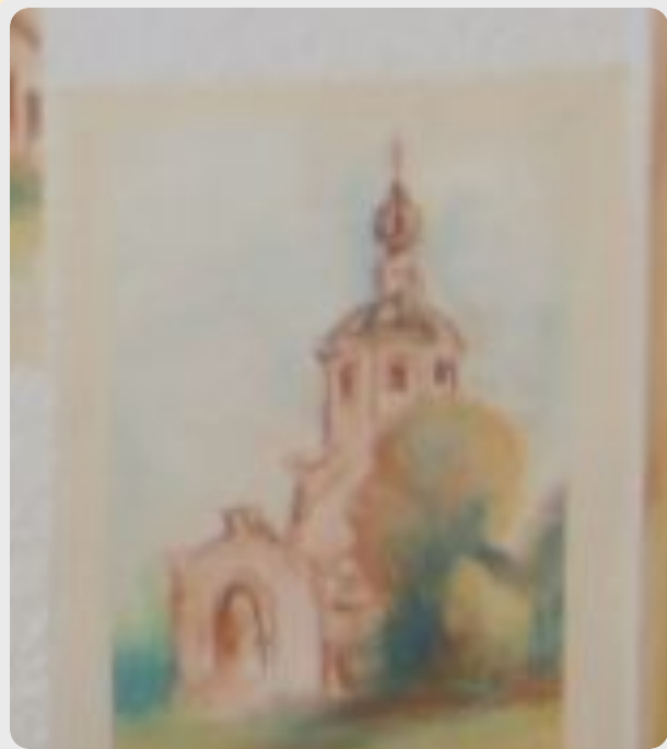
«Село Теселово. Храм»