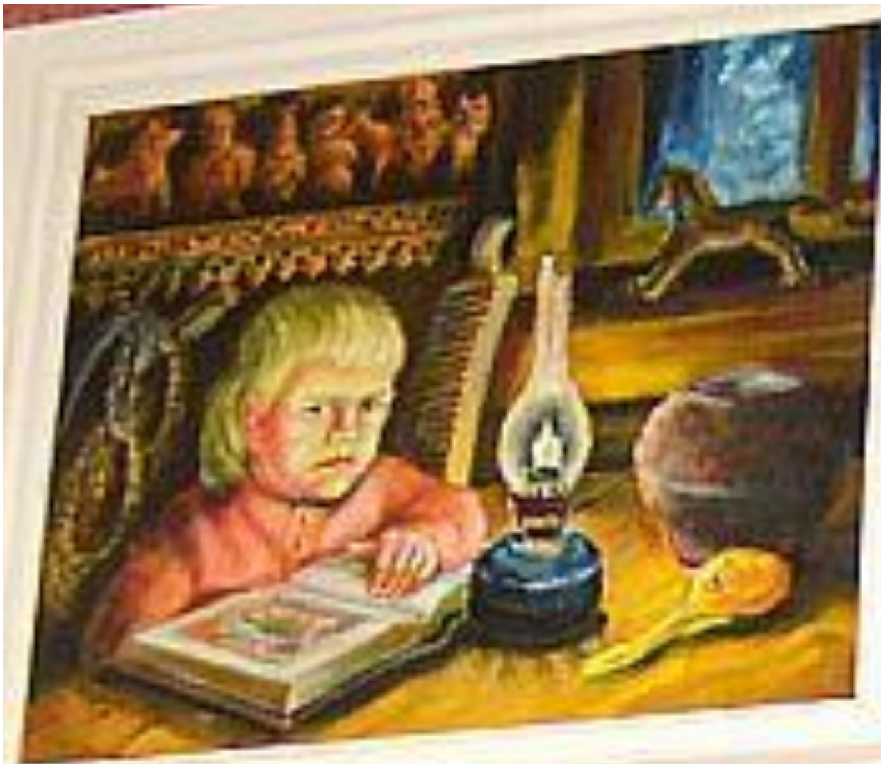
«УЧЕНИК ЦЕРКОВНО – ПРИХОДСКОЙ ШКОЛЫ»