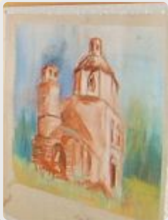
«Клин. Церковь Воскресения Христова»