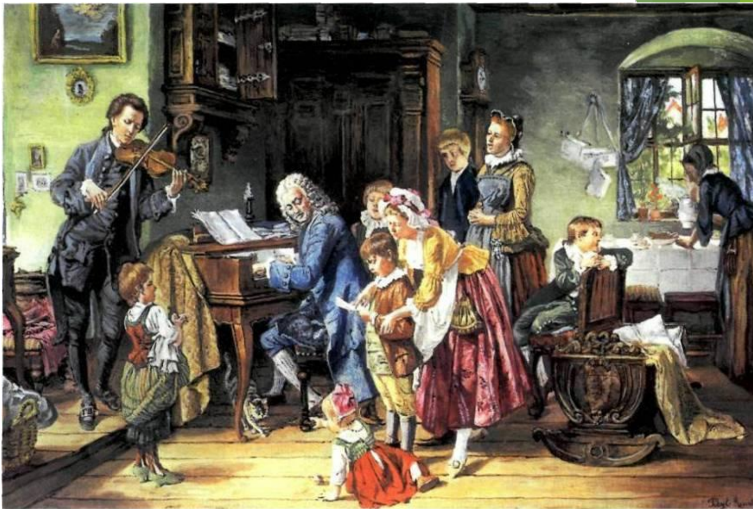
Семья И. С. Баха