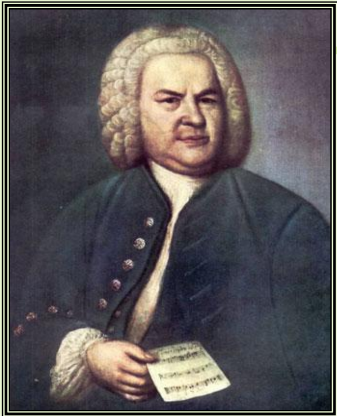
Иоганн Себастьян Бах- немецкий композитор , органист.