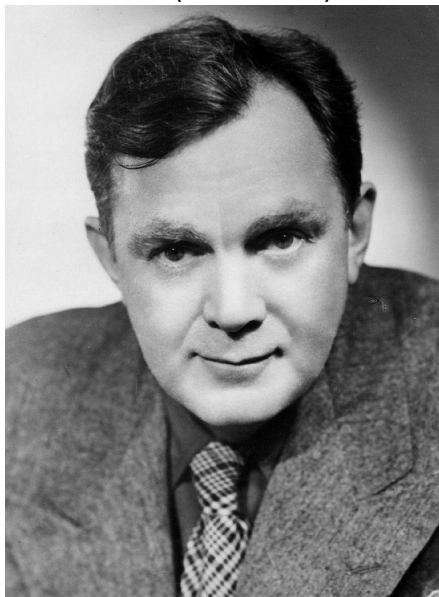
Томас Митчелл (1908-1951)