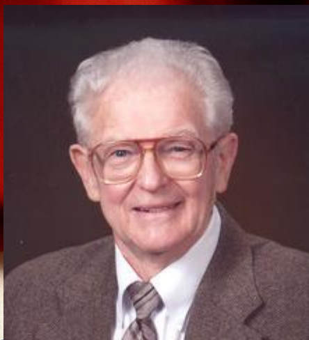
Роберт Хенри Робинсон (1921 – 2000)