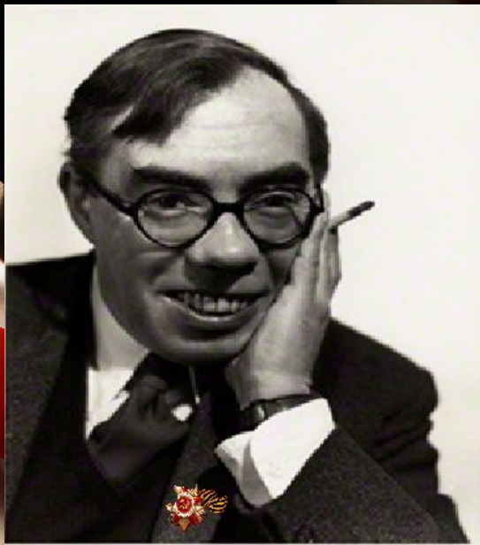
Уолтер Эрнест Аллен (1911 – 1995)