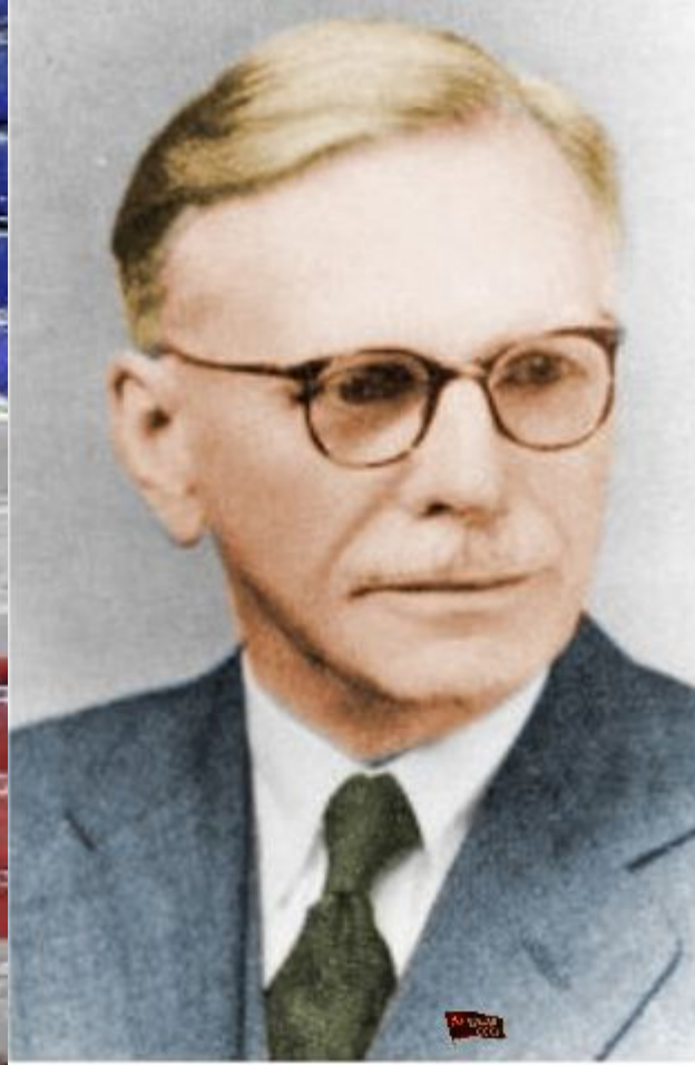
Джон Руперт Ферт (1890 – 1960)