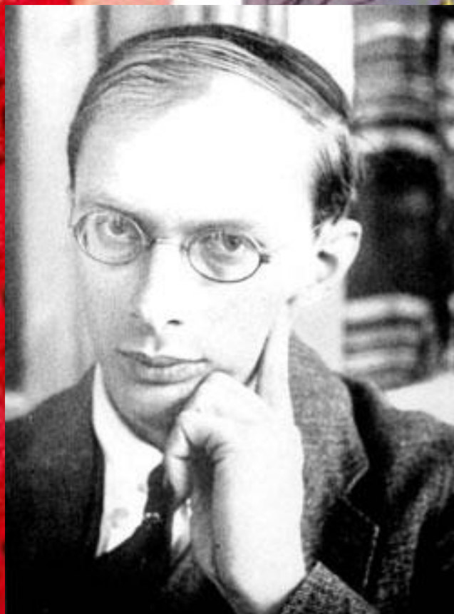
Бронислав Каспер Малиновский (1884—1942)