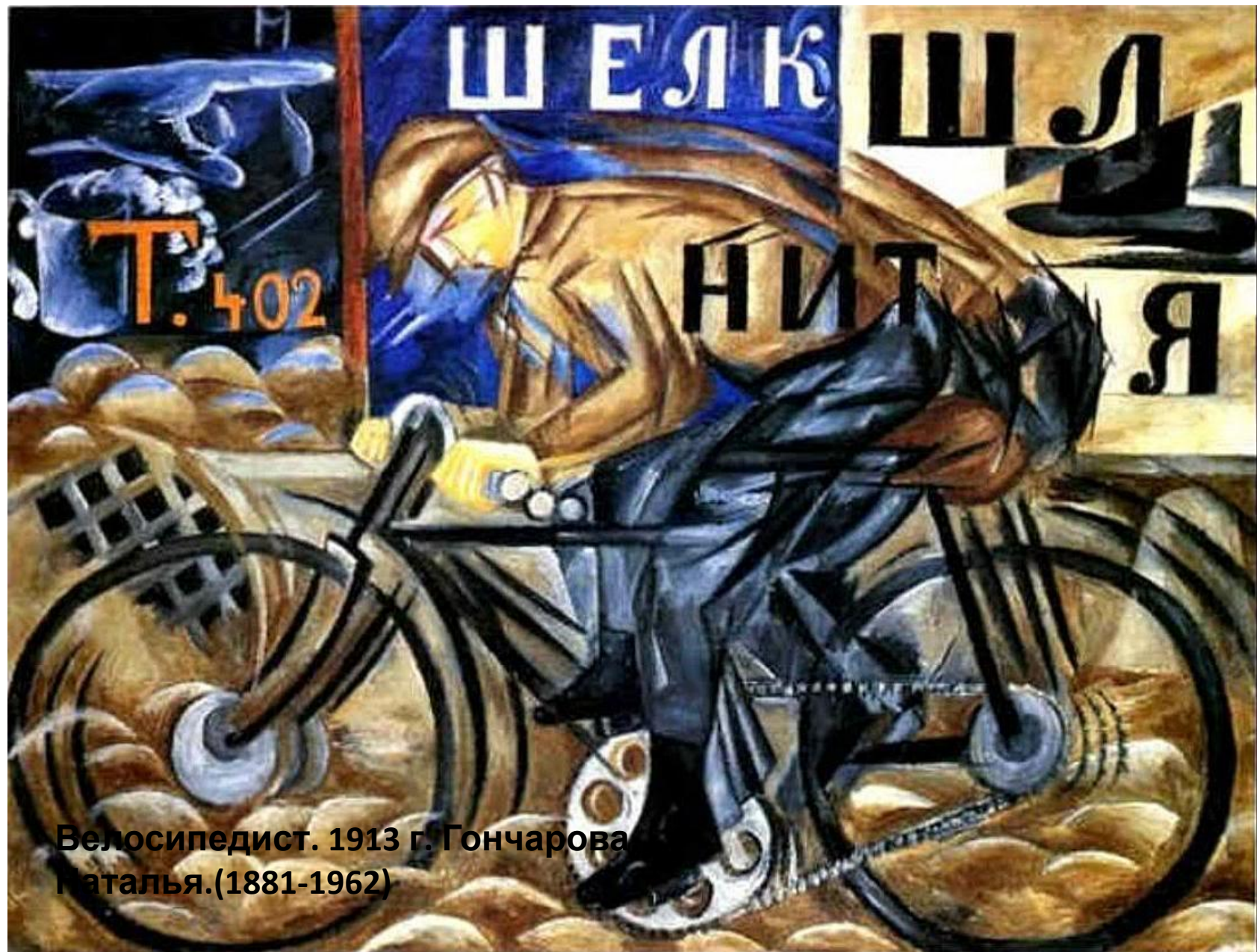
Велосипедист. 1913 г. Гончарова Наталья.(1881-1962)