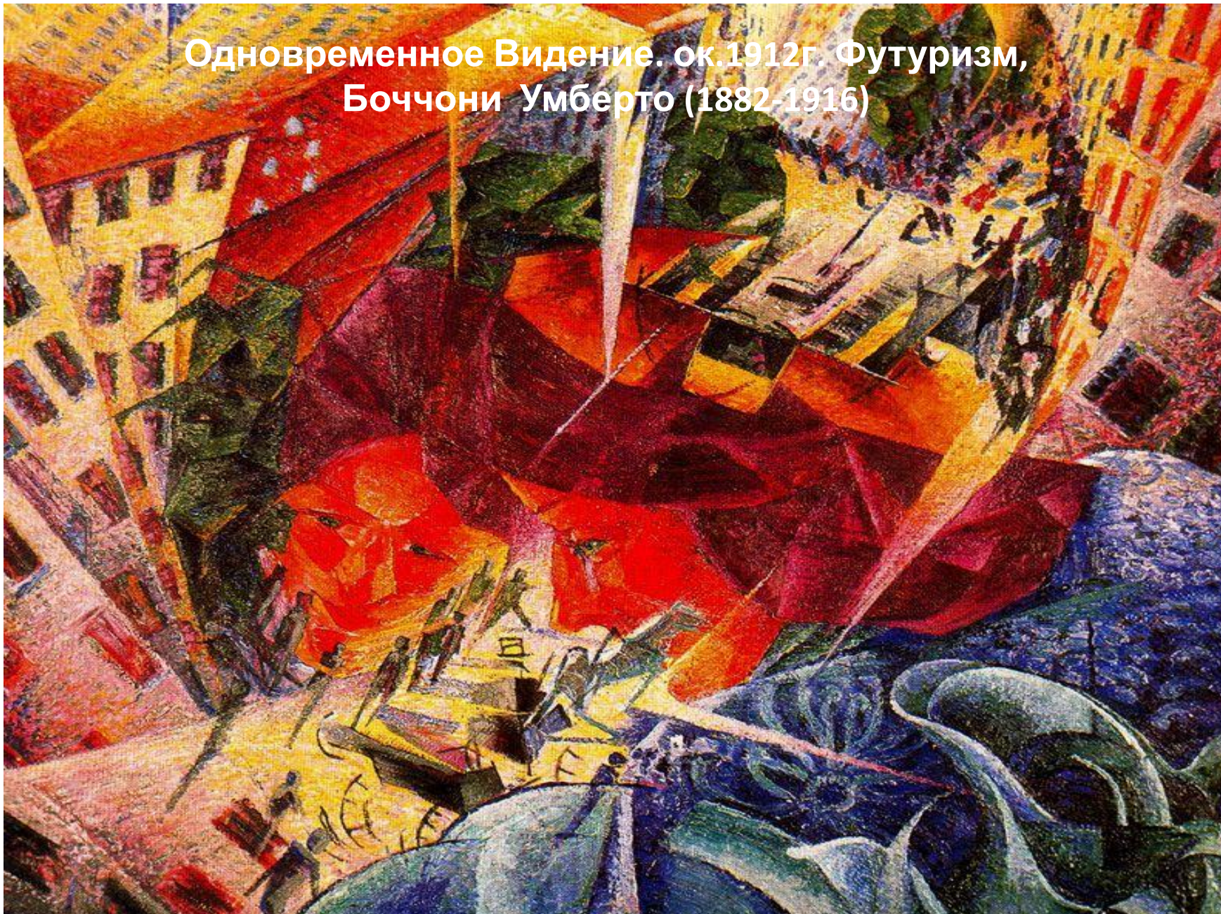
Одновременное Видение. ок.1912г. Футуризм, Боччони Умберто (1882-1916)