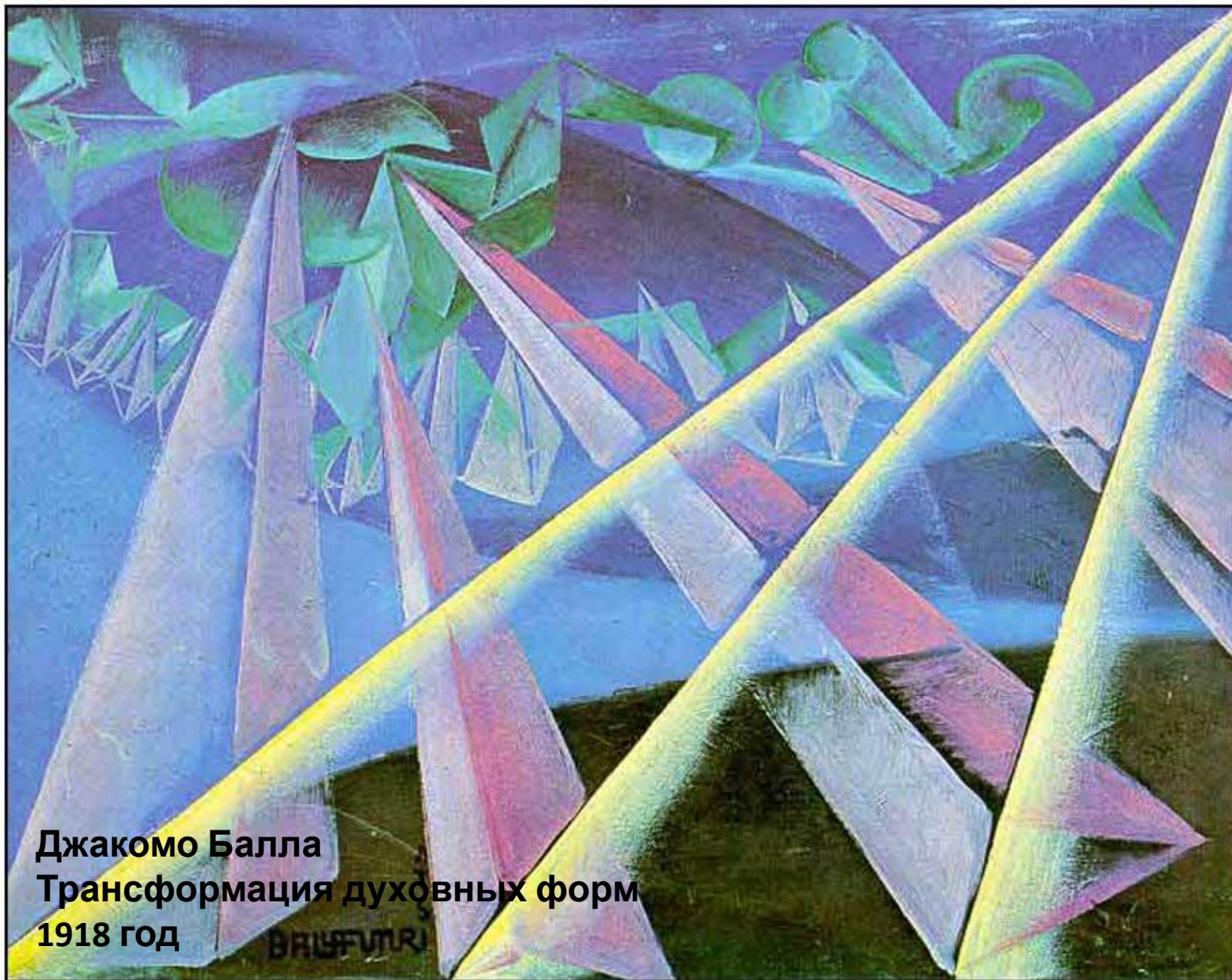
Джакомо Балла Трансформация духовных форм 1918 год