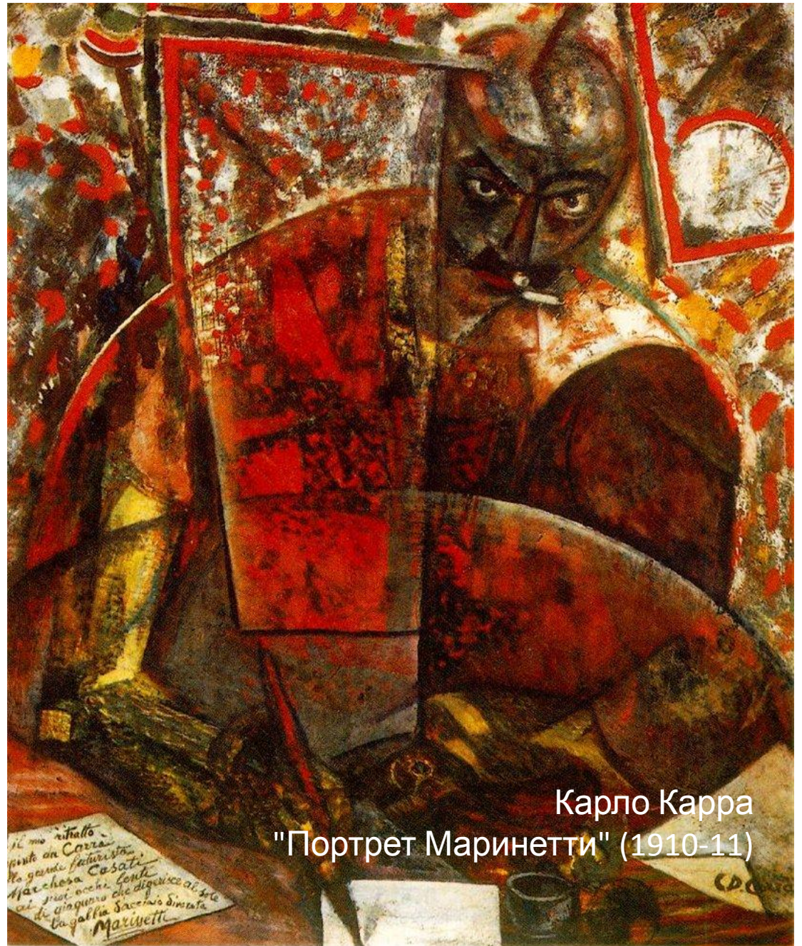
Карло Карра "Портрет Маринетти" (1910-11)