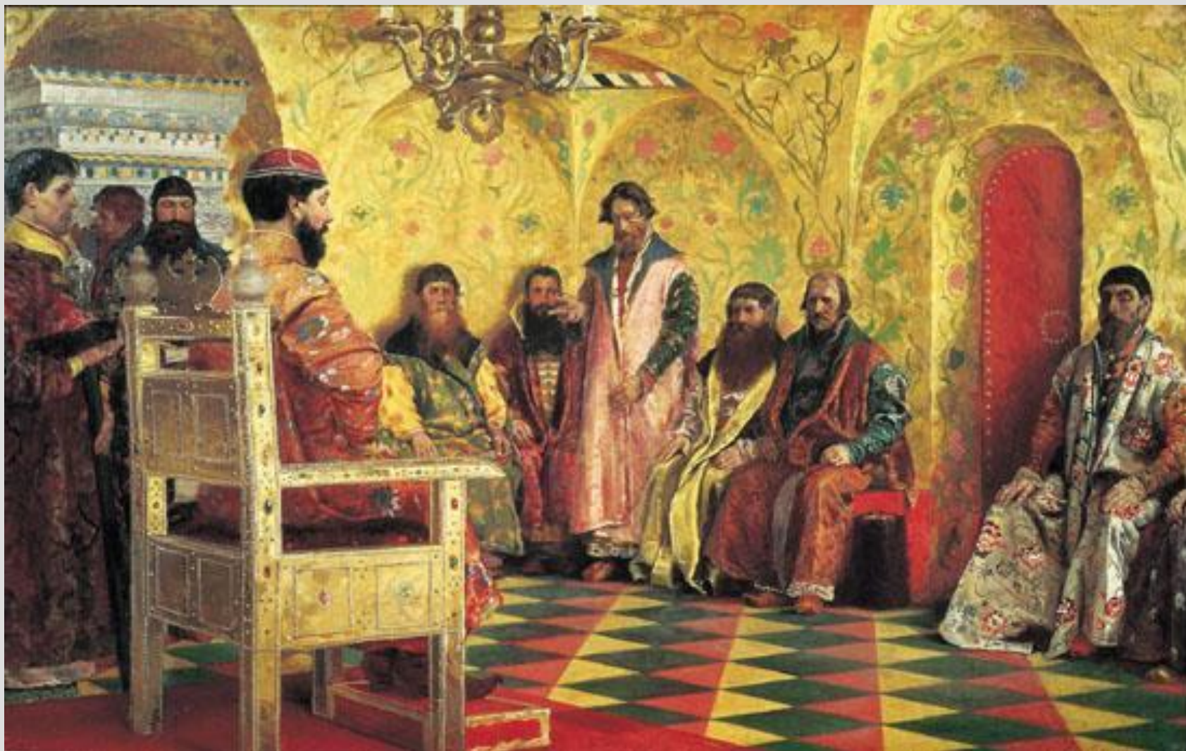
Глушкин А. Г. «Сидение царя Михаила Федоровича с боярами в его государевой комнате». 1893 г.